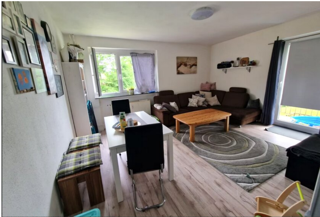
Wohnzimmer Ausgang Balkon