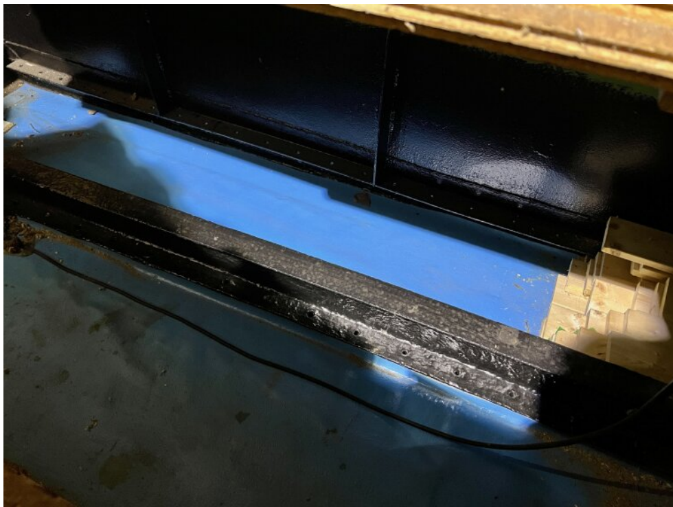
Erneuerter Rumpf (innen)