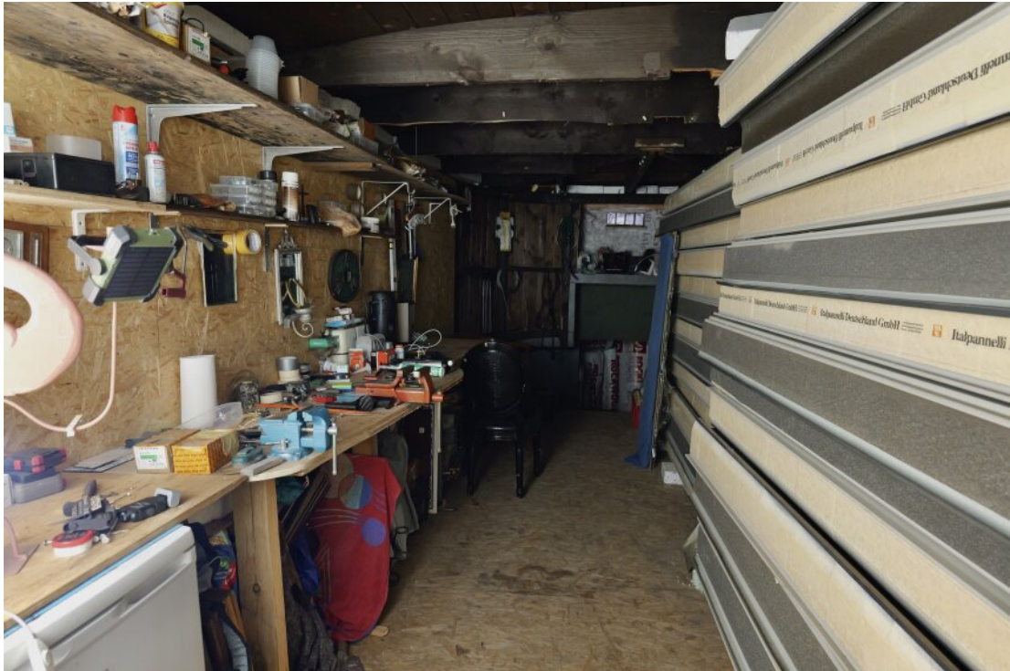
Werkbank im hinteren Teil