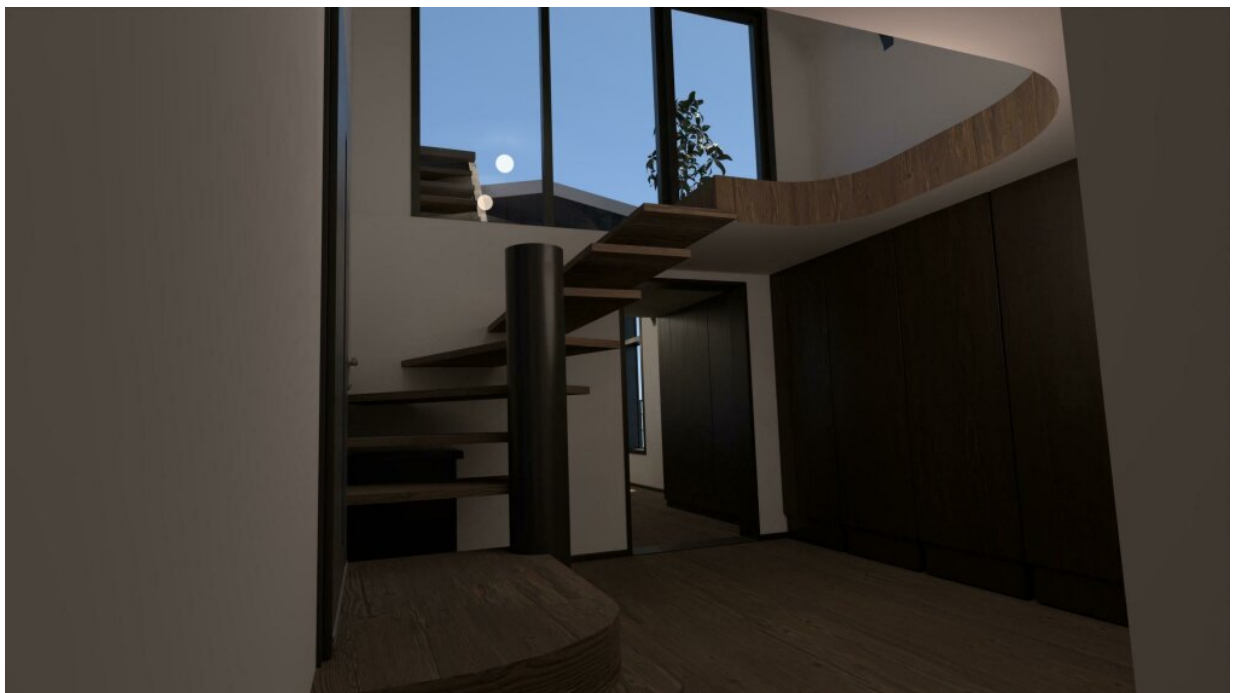
3D-Modell des Ausbaus