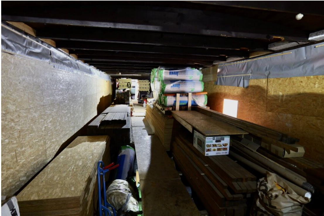
Innenbereich mit Baumaterial