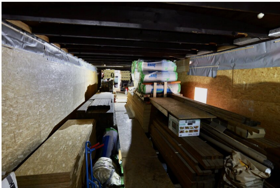
Innenbereich mit Baumaterial