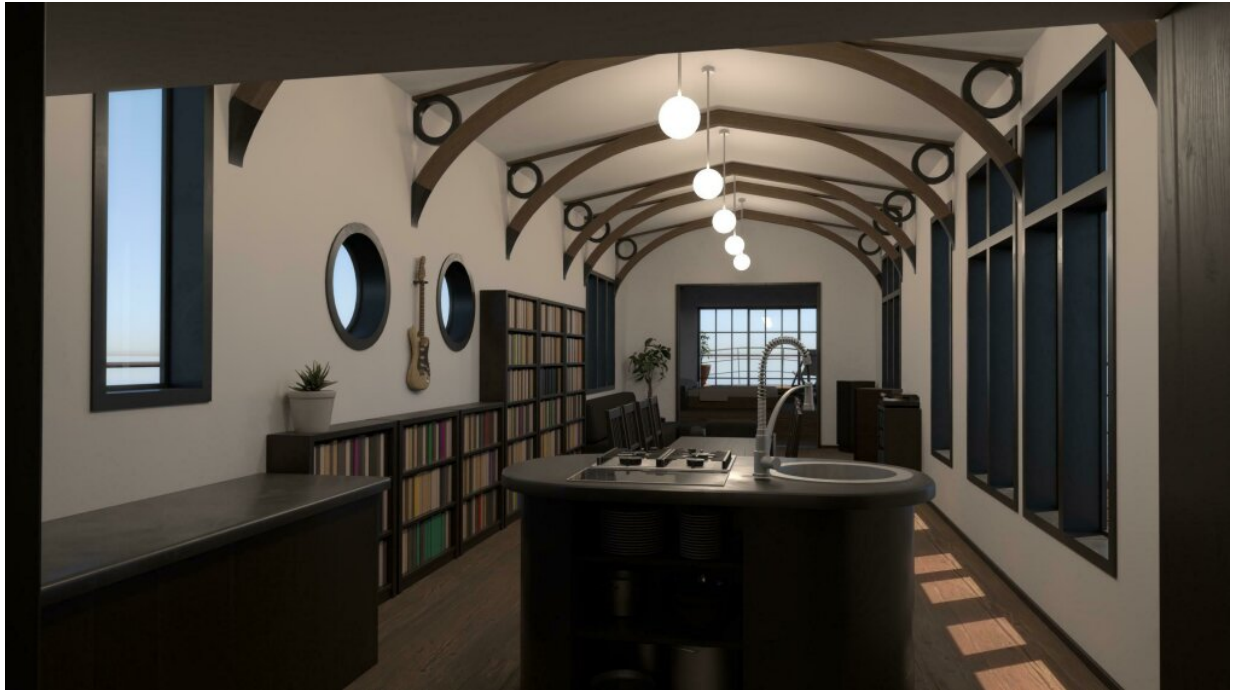
3D-Modell des Ausbaus