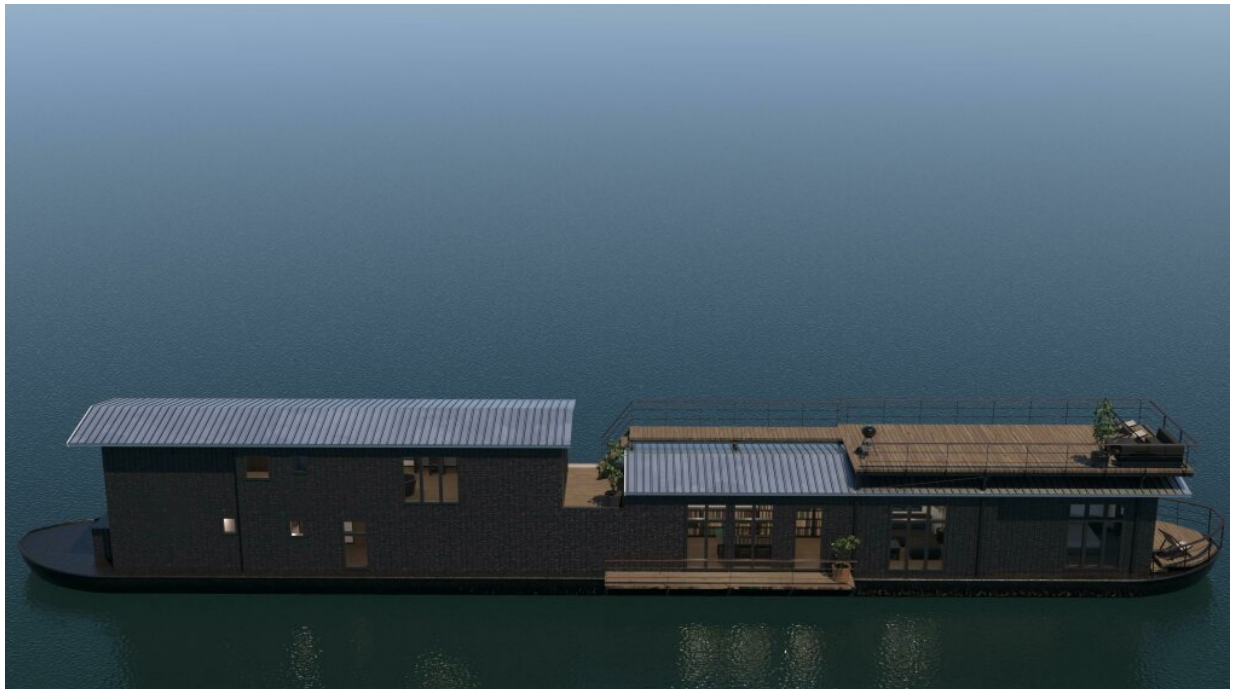
3D-Modell des Ausbaus