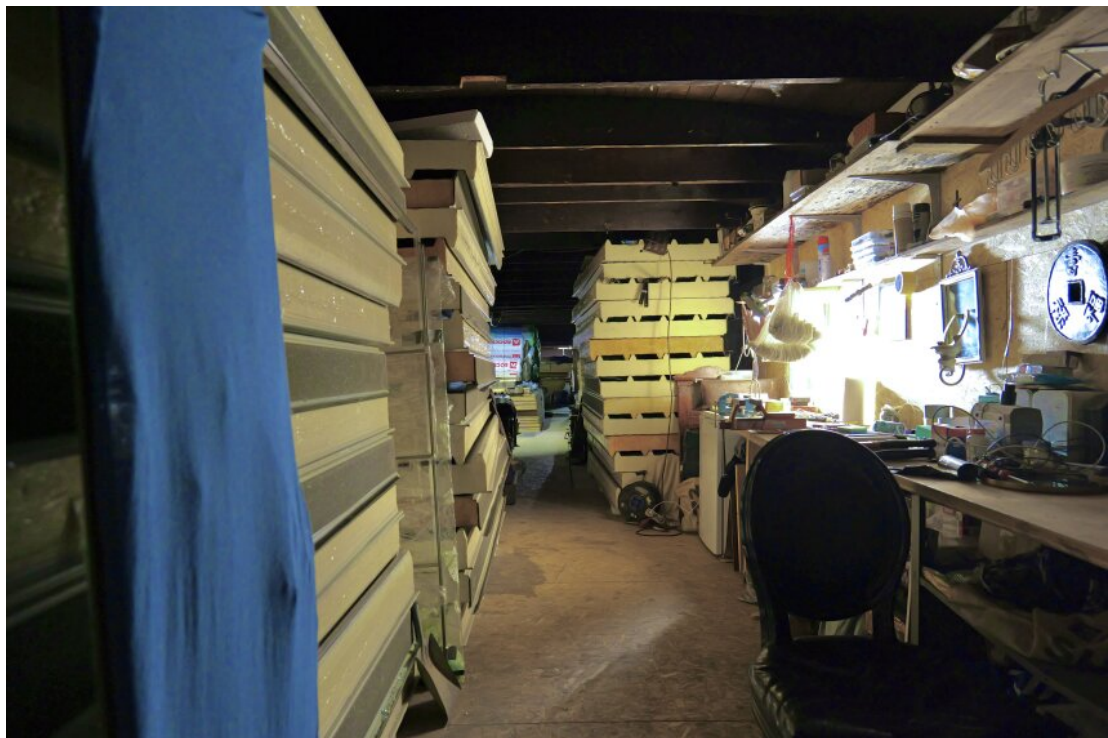
Innenbereich mit Baumaterial