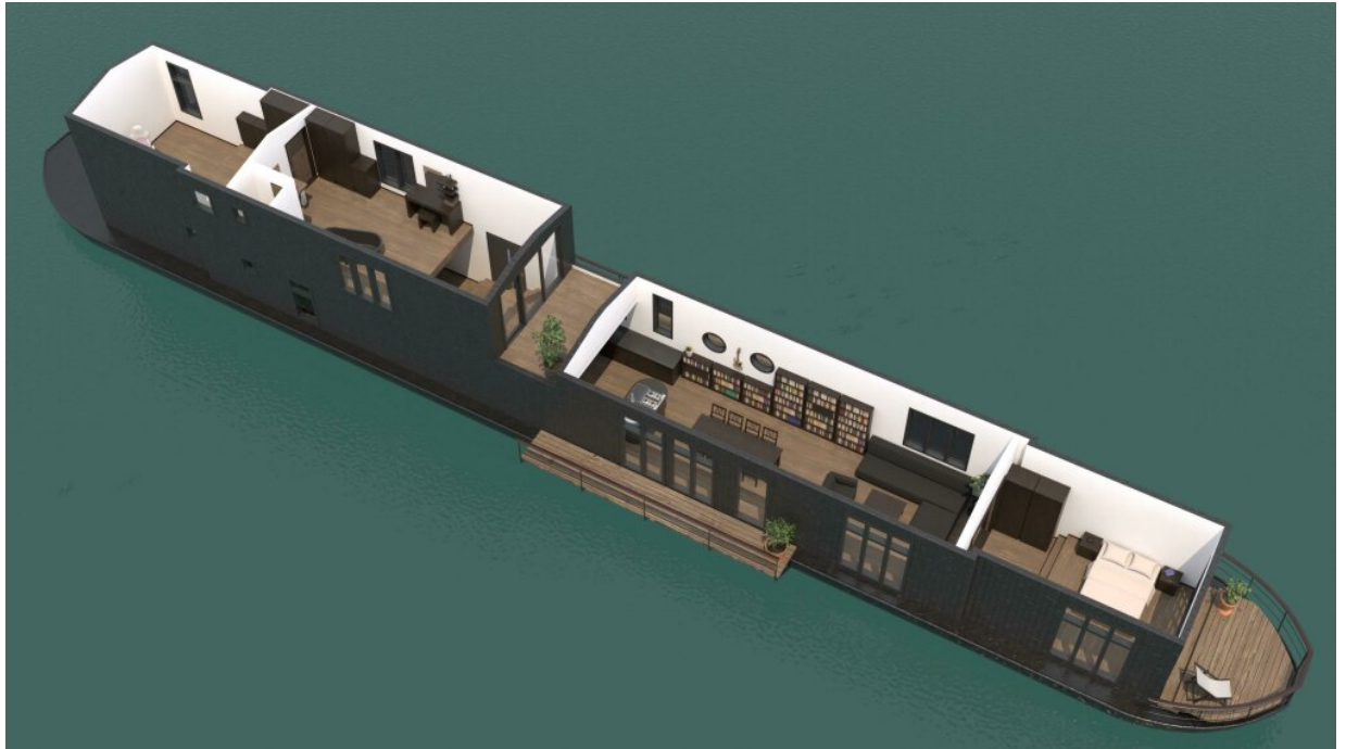
3D-Modell des Ausbaus