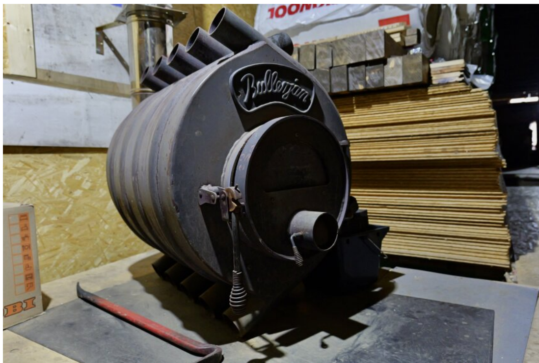
Der Ofen sorgt für Wärme