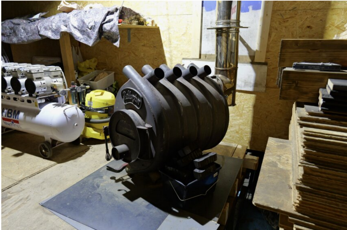
im gesamten Boot