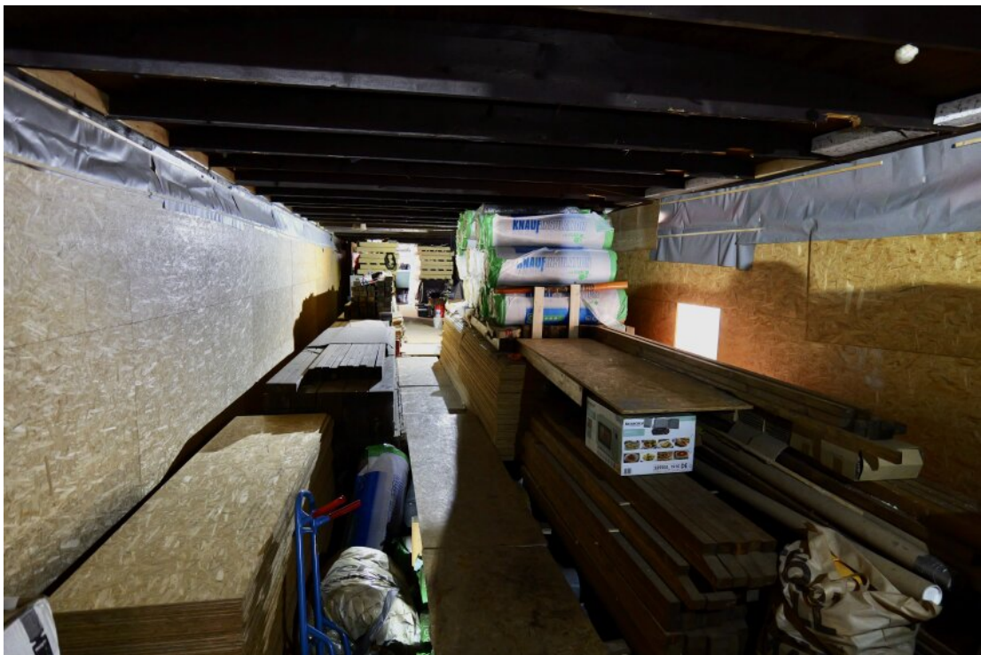
Innenbereich mit Baumaterial