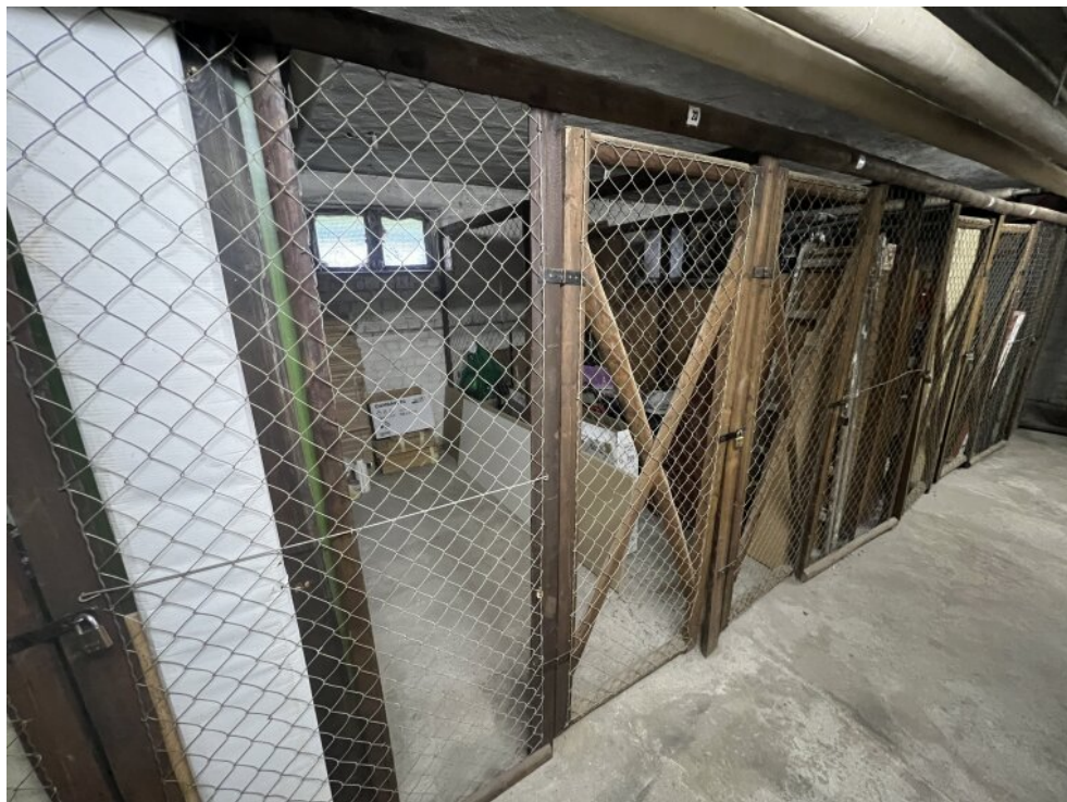
Eigenes Kellerabteil (trocken)