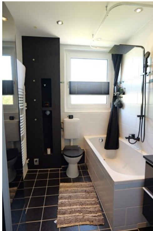
Tageslichtbad mit Dusche