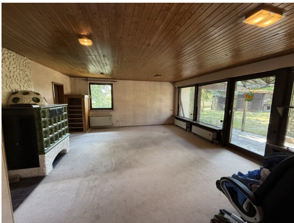
Wohnzimmer und Esszimmer