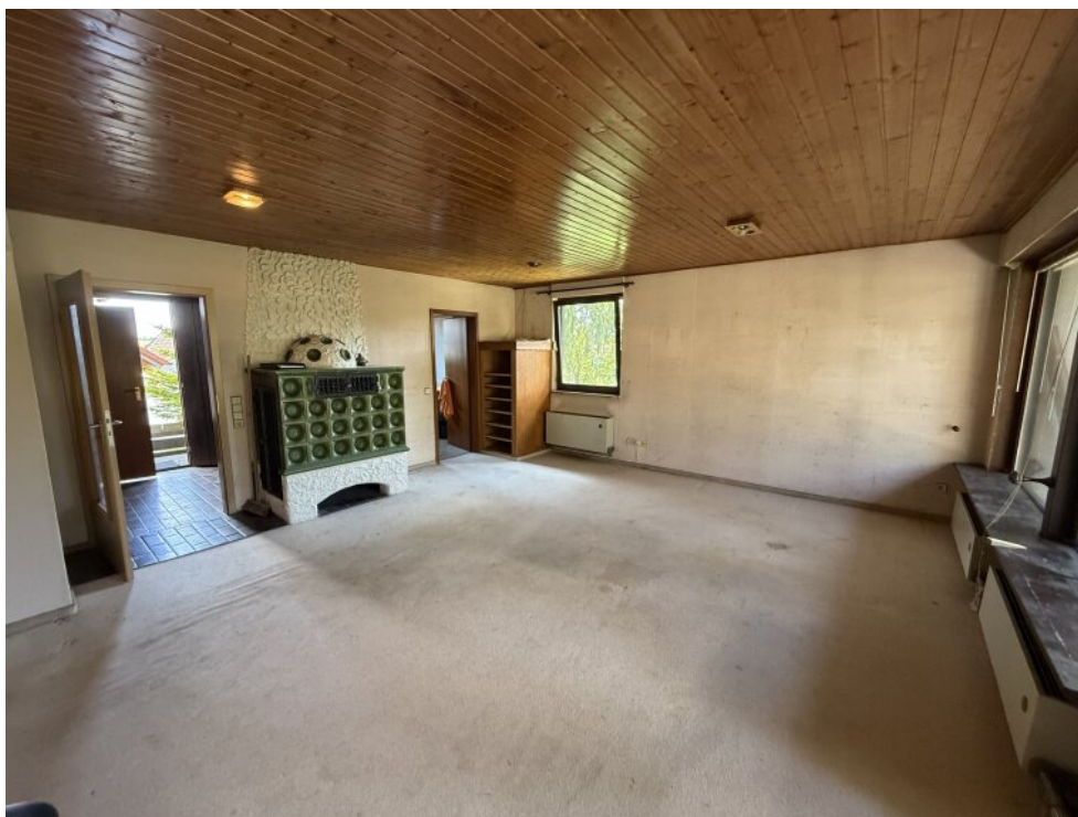
Wohnzimmer und Esszimmer