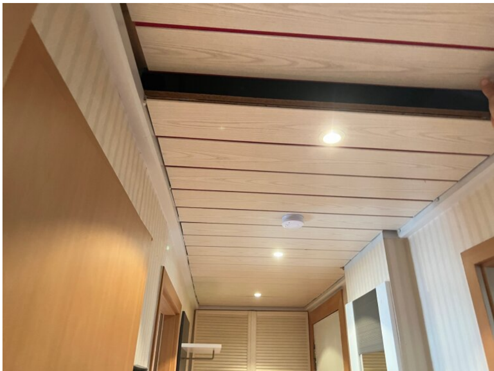
Zugang zum Kriech-Boden