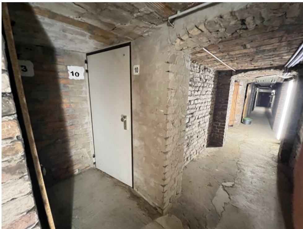
Kellerabteil mit sicherer Tür