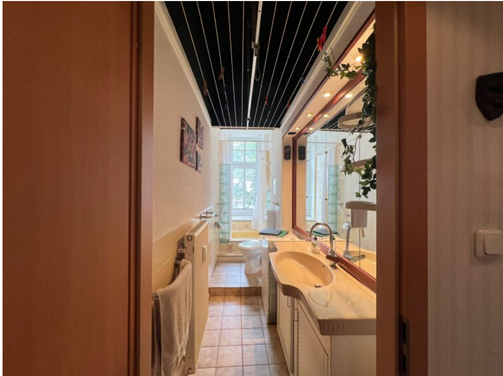
Helles Bad mit hoher Decke