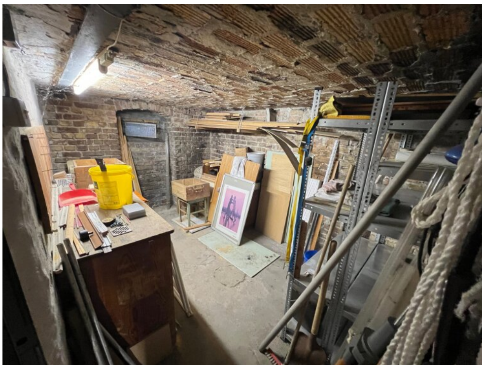
Trocken und Schimmelfrei