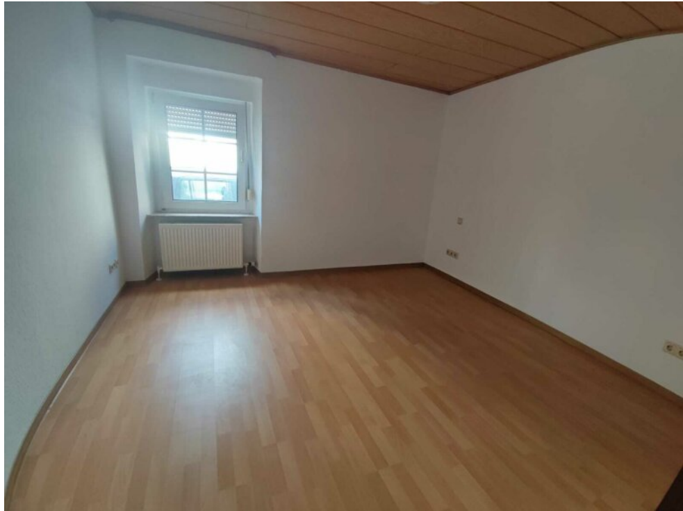
Schlafzimmer ruhig nach hinten