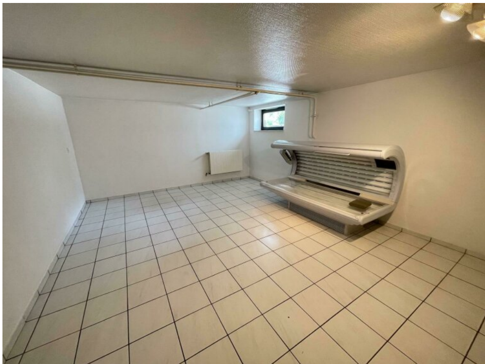
Keller mit Solarium