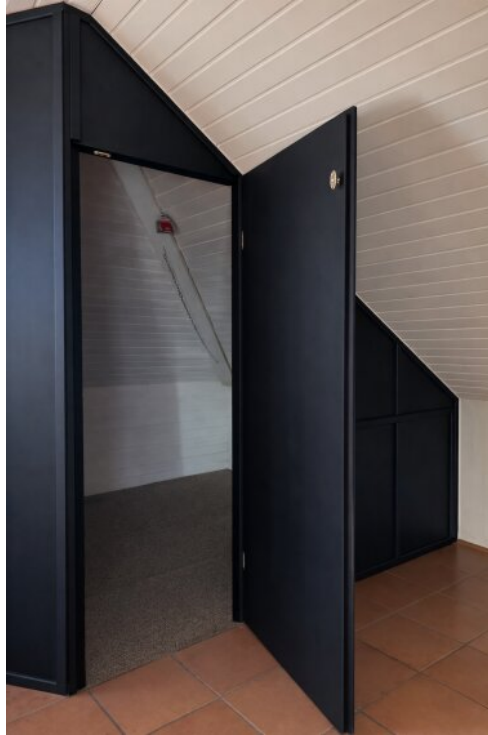
OG - Einbauschränk