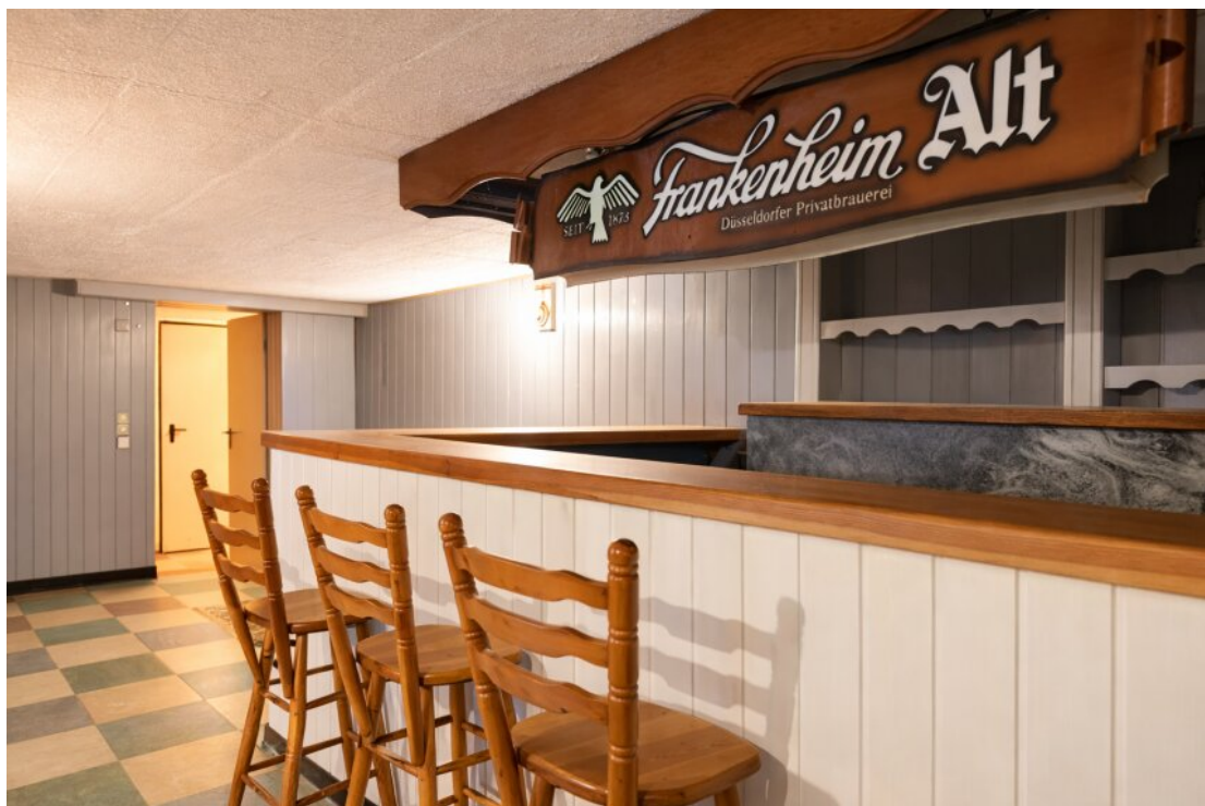
UG - Hobbyraum mit Bar