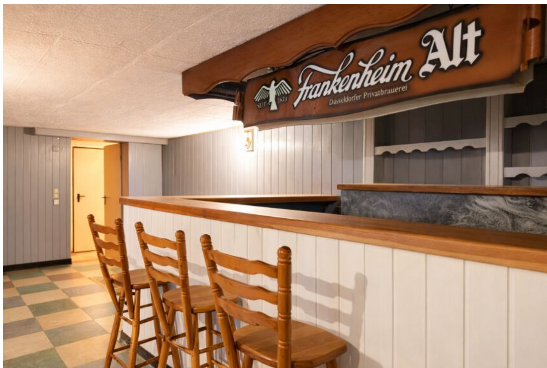
UG - Hobbyraum mit Bar