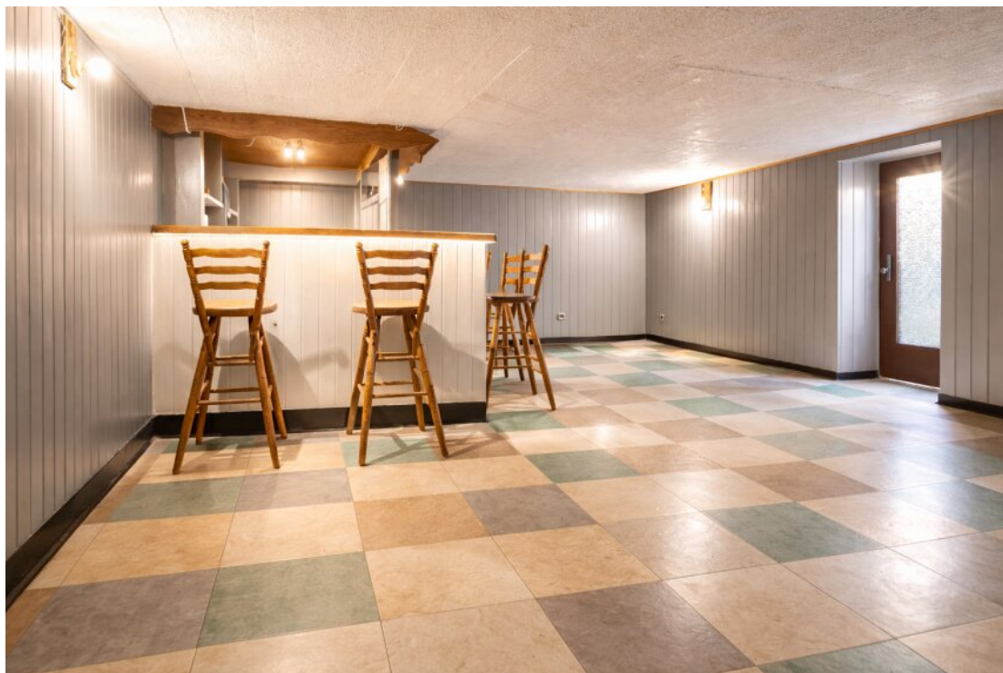
UG - Hobbyraum mit Ausgang