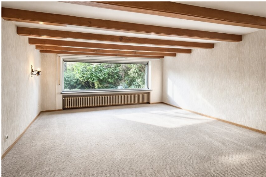
EG - Wohnzimmer