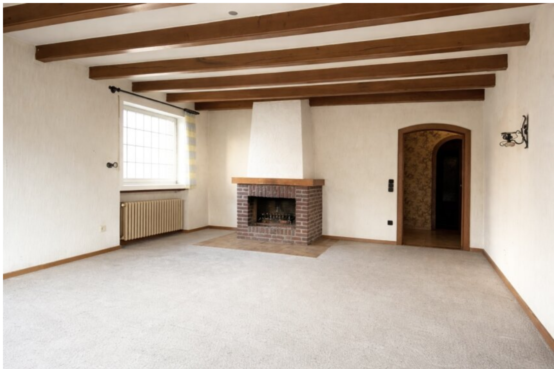
EG - Wohnzimmer mit Kamin