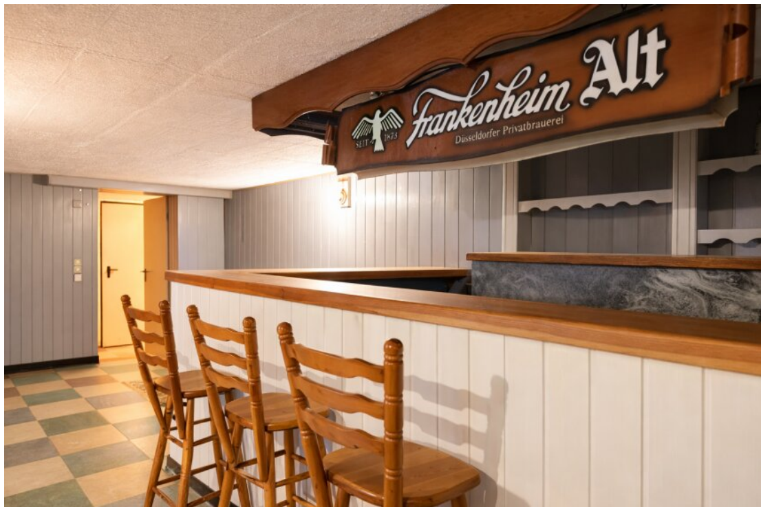
UG - Hobbyraum mit Bar