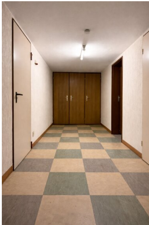
UG - Flur