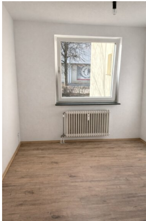
Kind / Büro