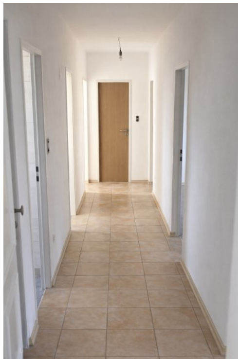
Flur / Eingang