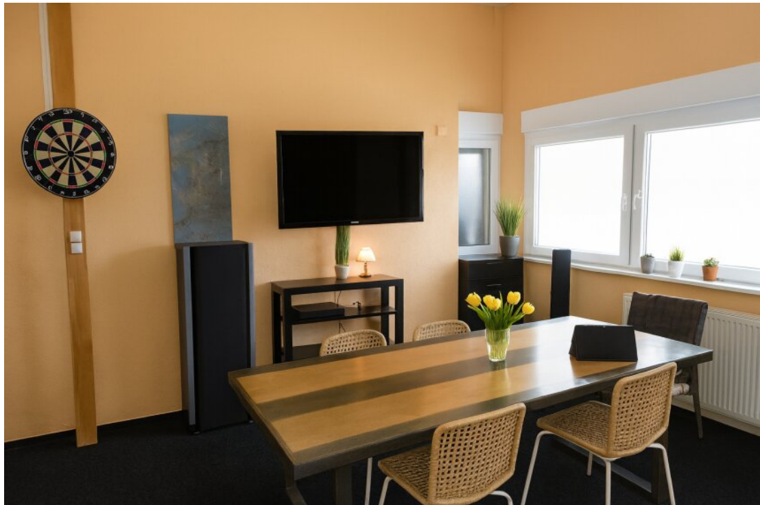
Wohnzimmer / Büro