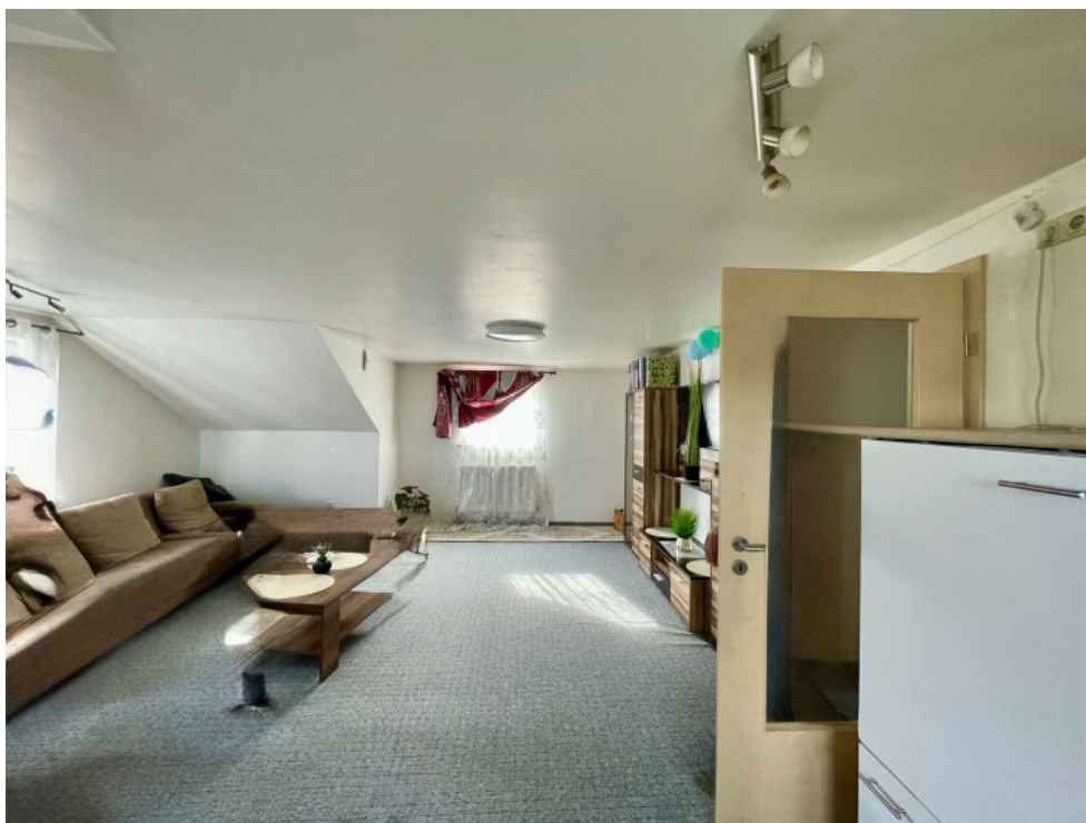
Wohnzimmer im DG