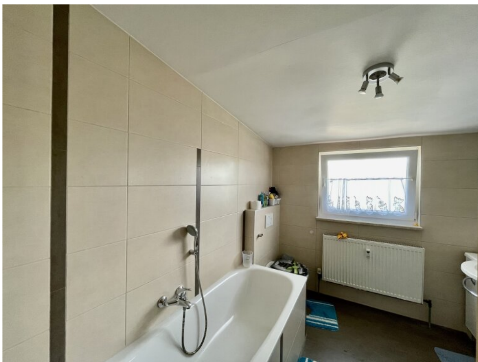
Bad im DG