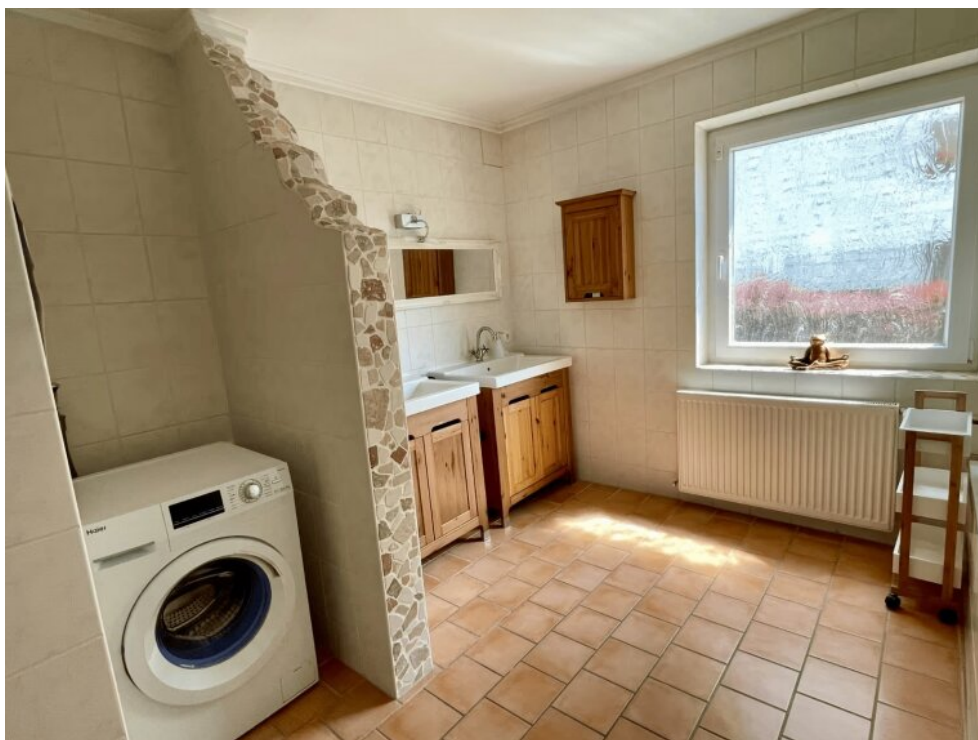
Bad mit Doppelwaschbecken