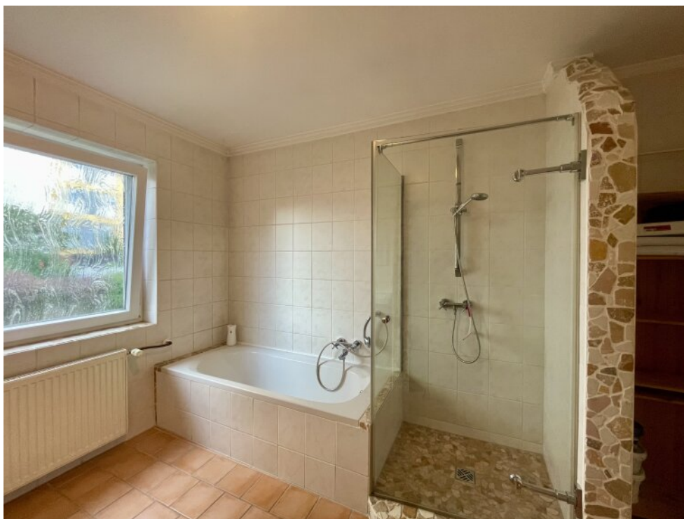
Bad mit Dusche und Bad