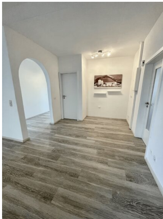
Seminarraum mit eig. Eingang