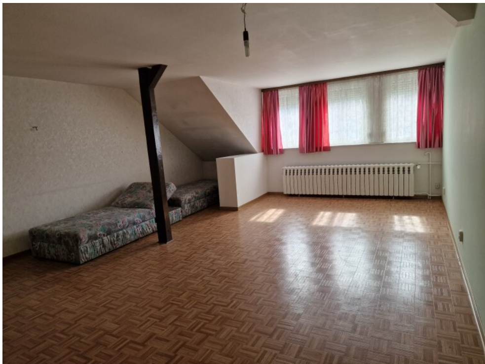
4 Schlafzimmer DG