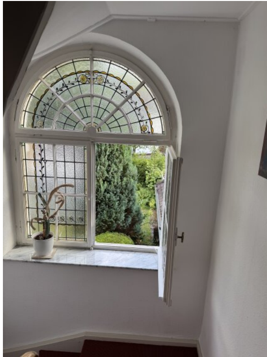
Fenster im Treppenhaus