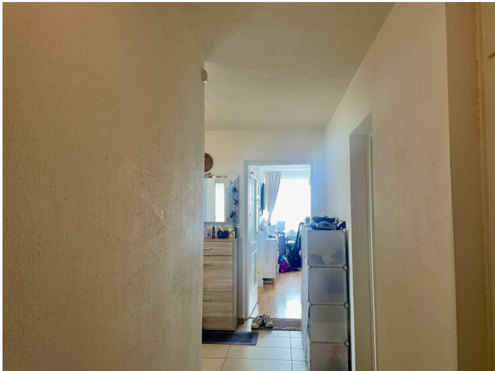
Blick in die Wohnung