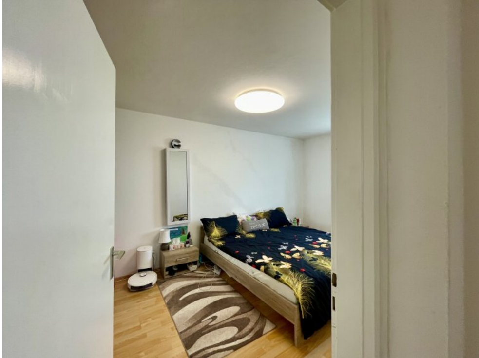
Blick ins Schlafzimmer