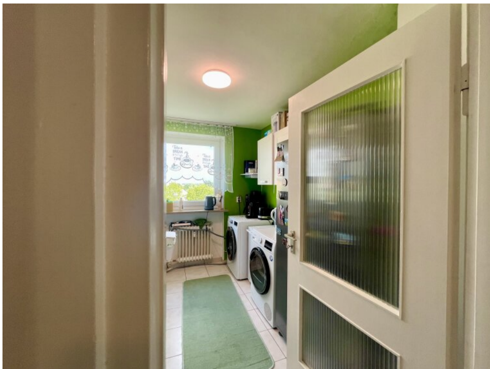
Küche mit Anschluss für Waschm