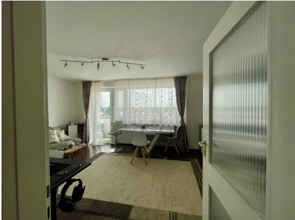
Wohnzimmer Zugang zum Balkon