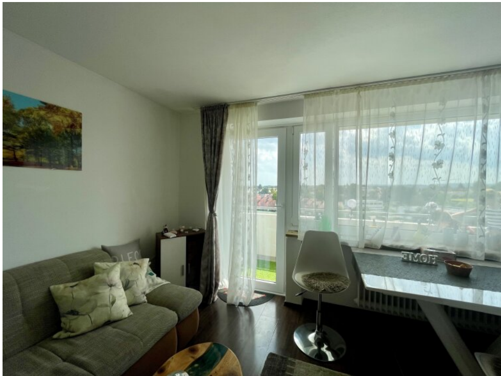
Wohnzimmer Zugang zum Balkon