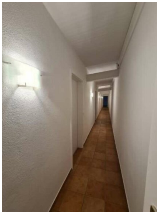
Flur zu WHG