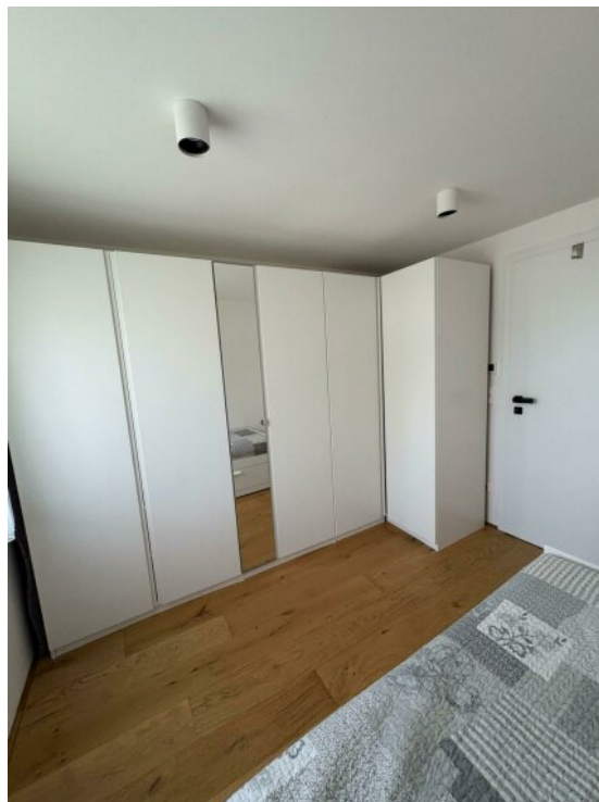
Kinderzimmer / Büro