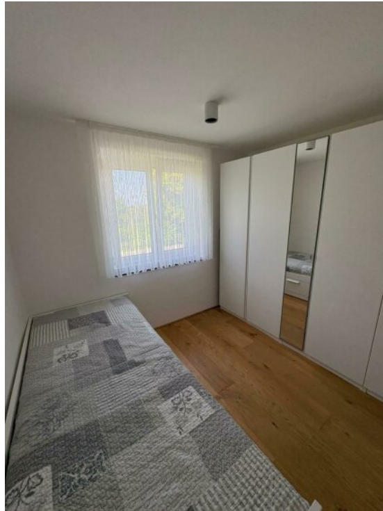
Kinderzimmer / Büro