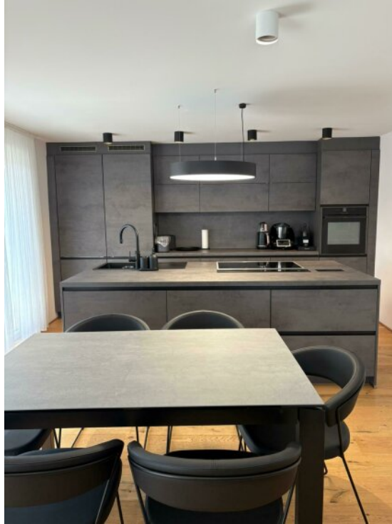
Küche / Essbereich