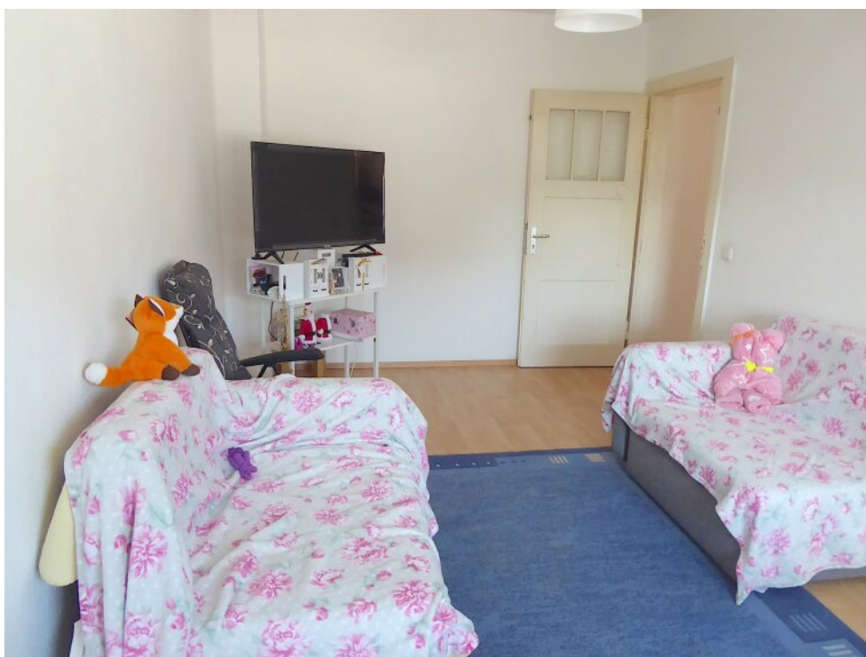
Wohnzimmer im. OG