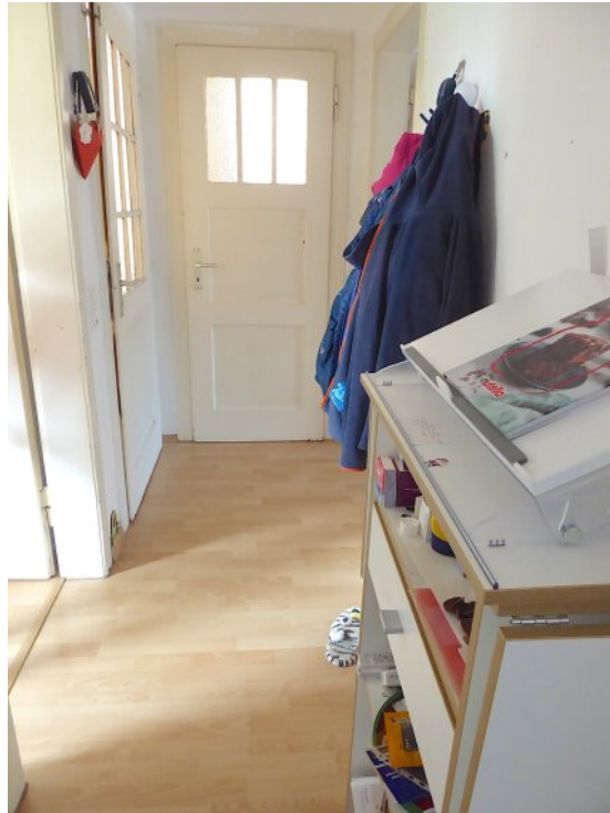
Flur Wohnung im OG