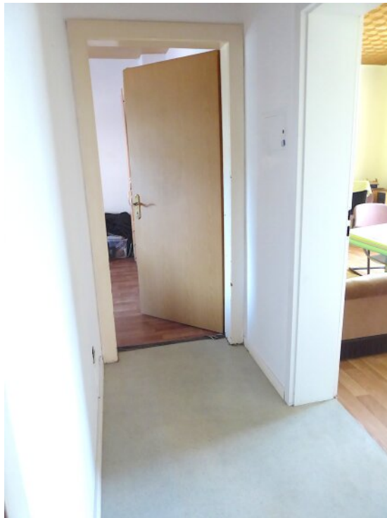
Flur Wohnung EG