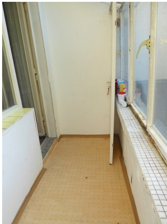
Wintergarten im EG