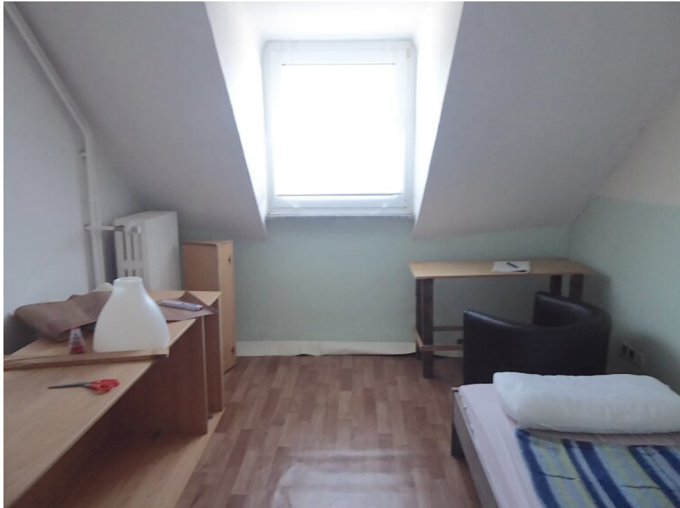
Schlafzimmer im DG