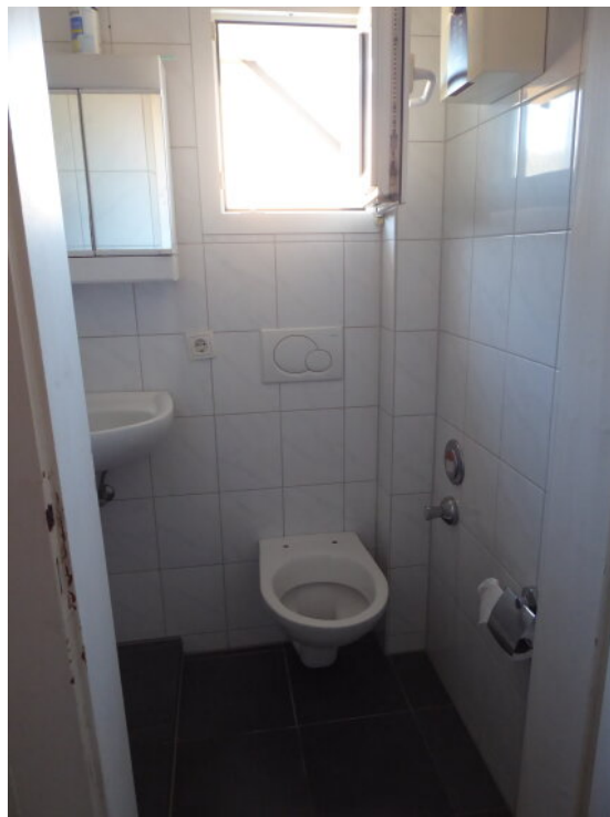
Tageslicht Duschbad DG