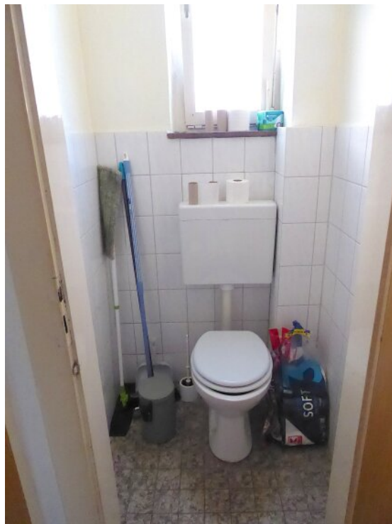
Tageslicht WC EG