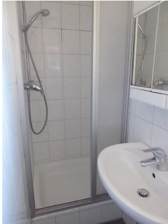
Dusche im Bad DG