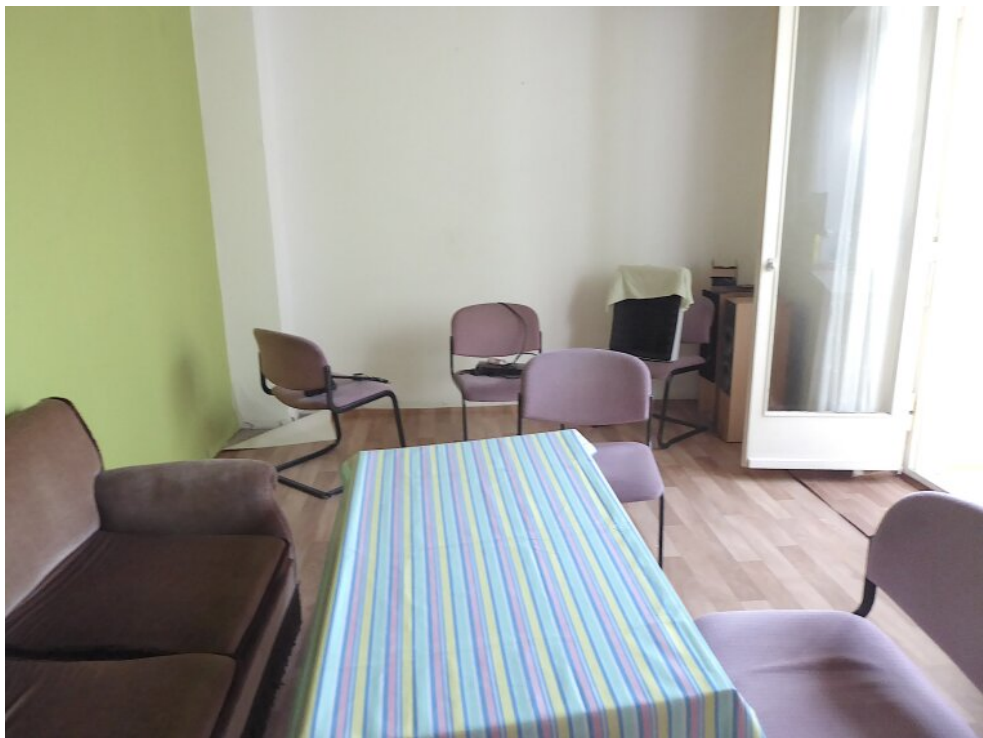
Wohnzimmer im EG