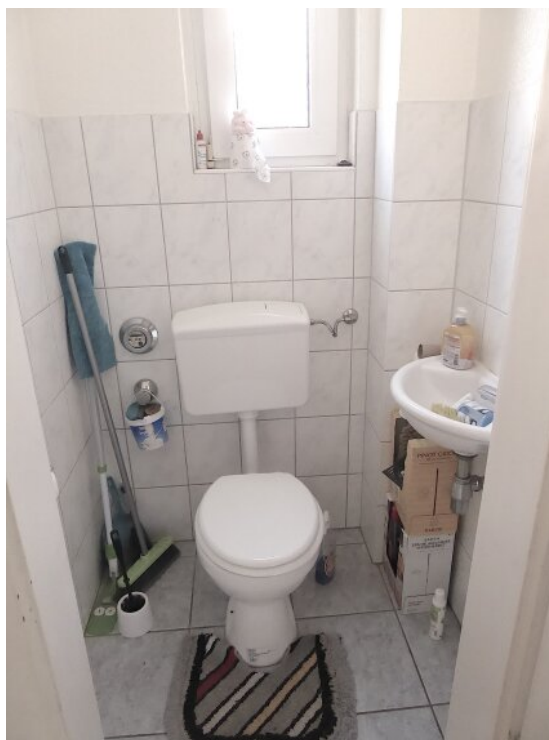
Tageslicht WC OG