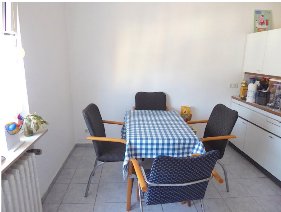
Küche im OG