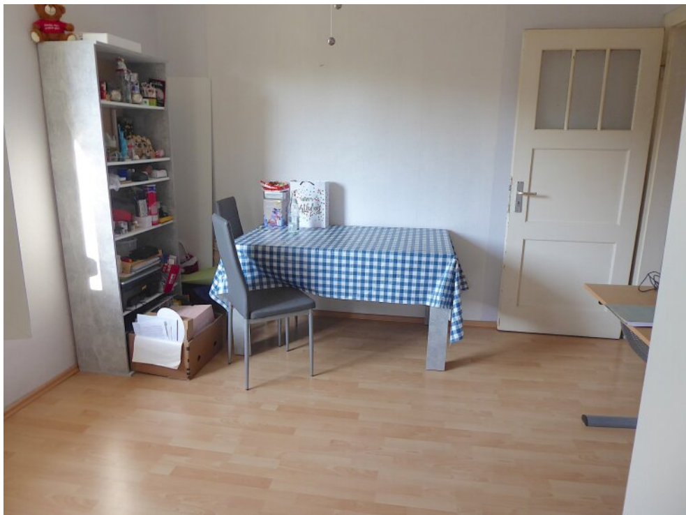
Schlafzimmer im OG