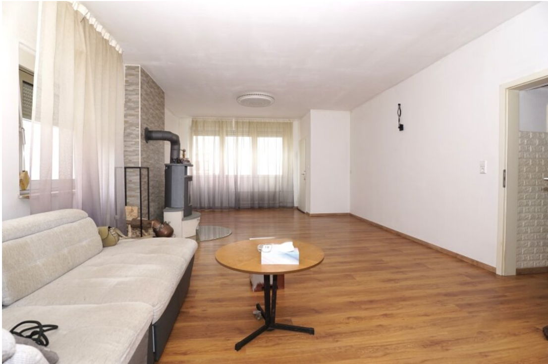
EG Wohn Esszimmer