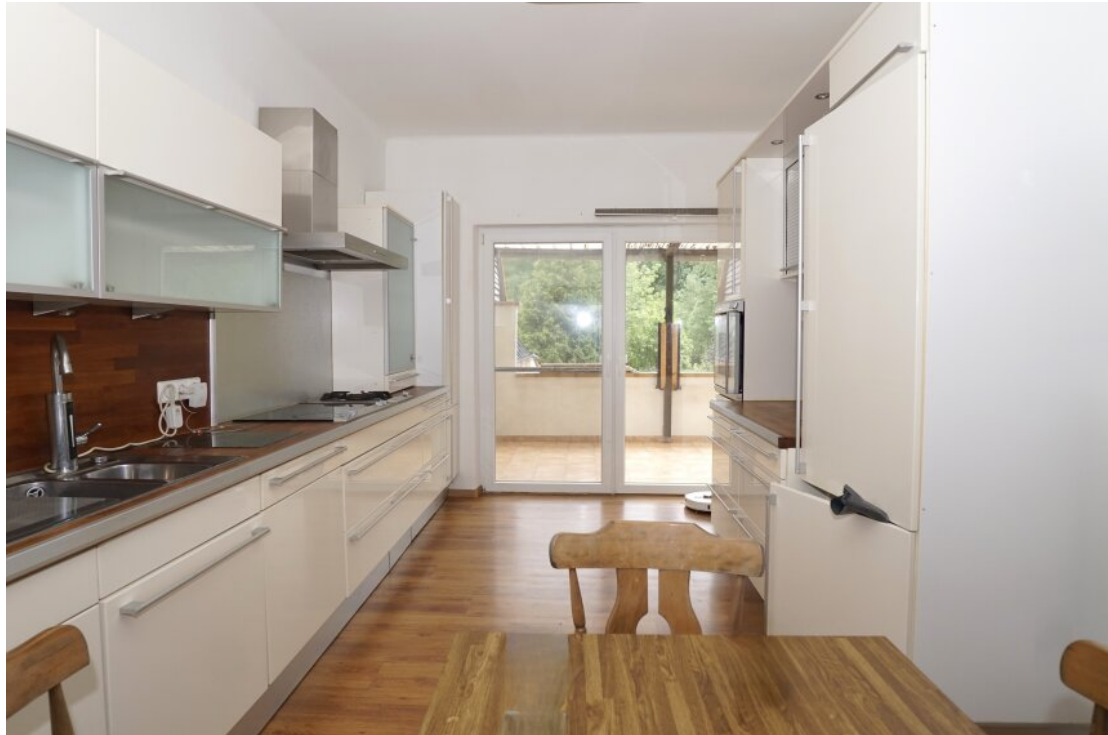
EG Essküche mit Balkon