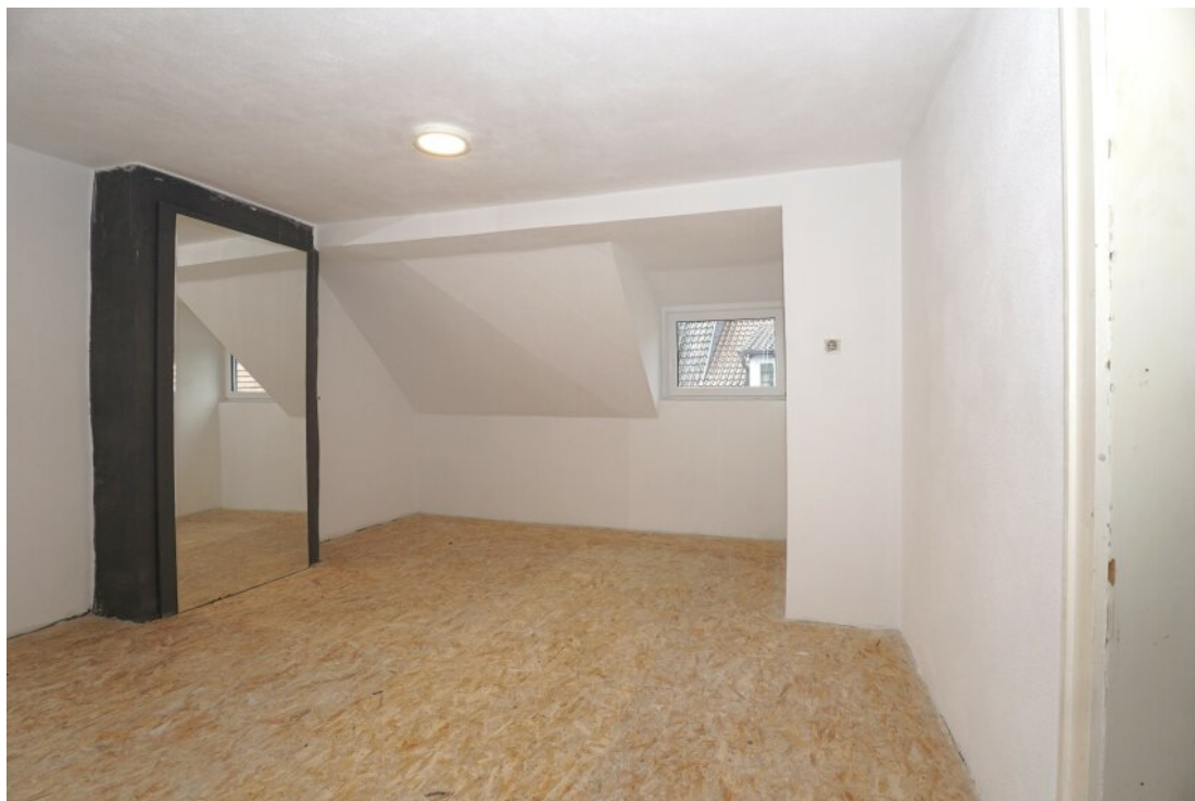
DG Gästezimmer mit Ankleide