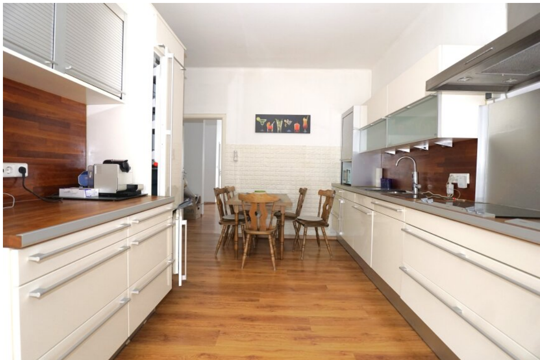
EG Essküche mit Balkon