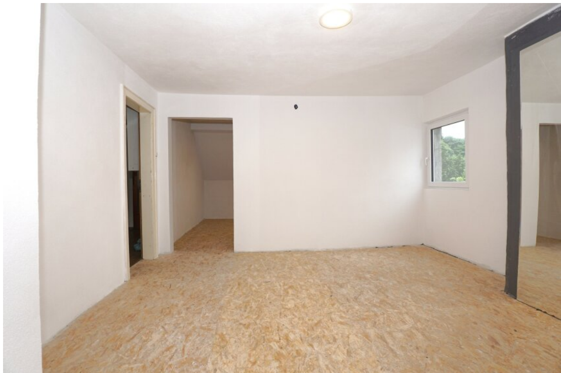
DG Gästezimmer mit Ankleide