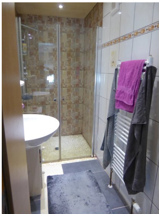
Duschbad im Schlafzimmer OG