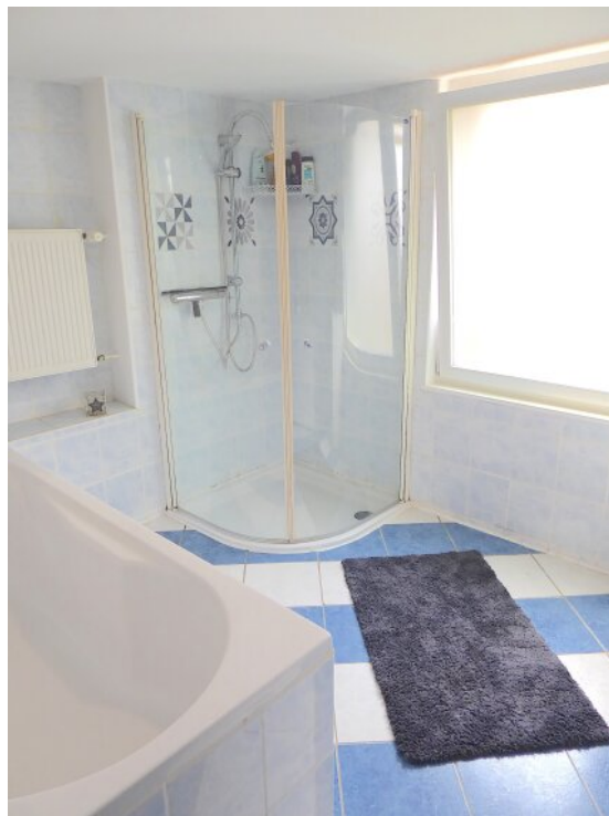
Bad mit Wanne und Dusche EG