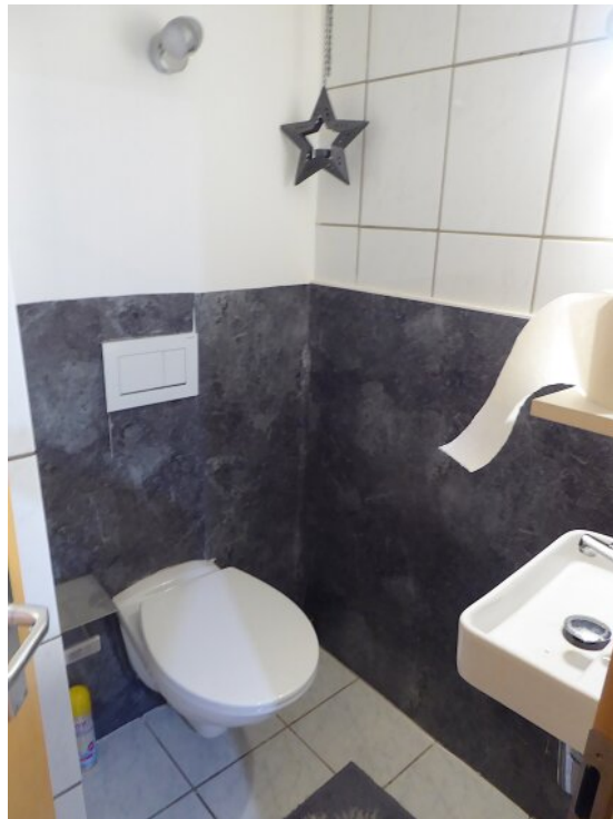
Gäste WC OG