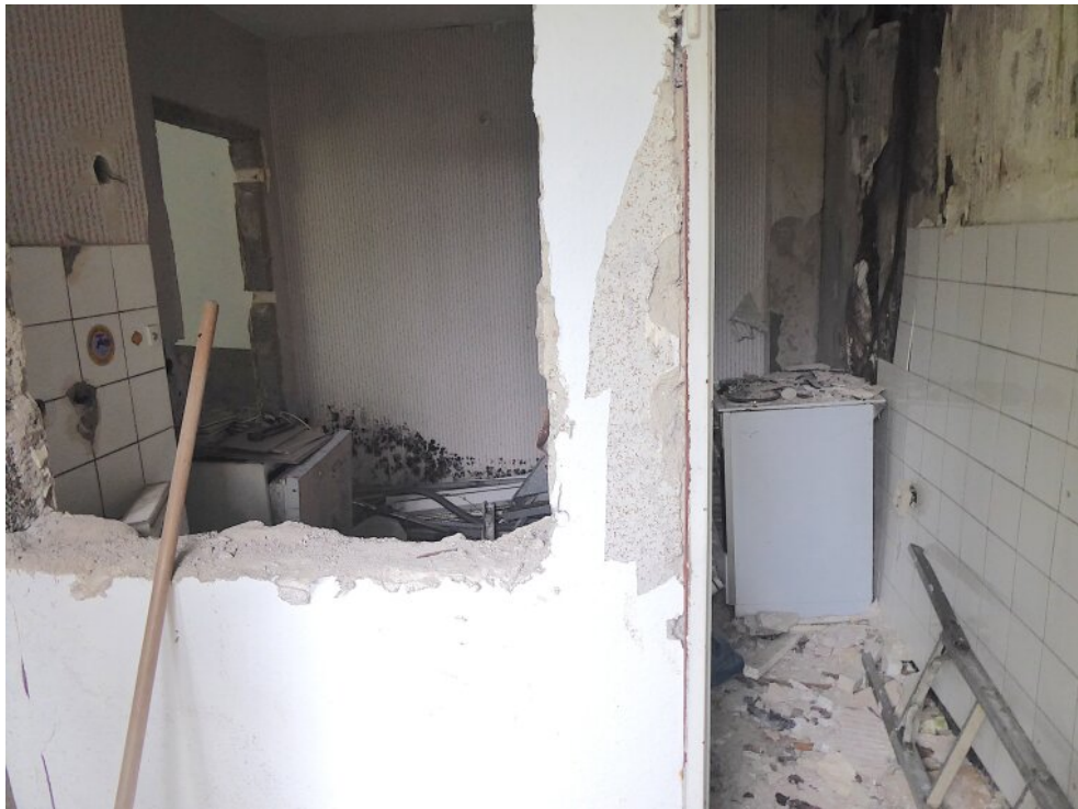
Küche im Anbau