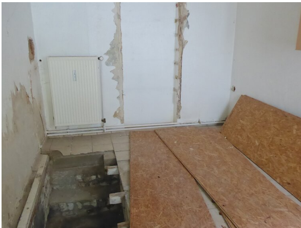
Raum mit Treppe in den Keller vorne