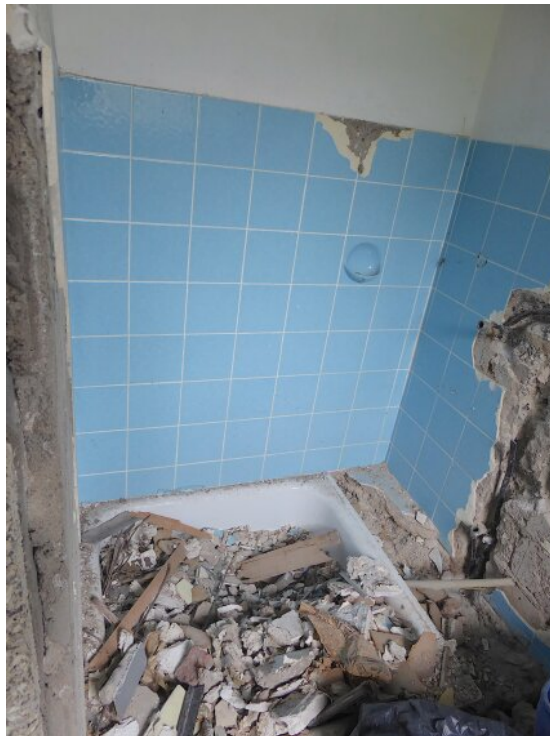
Duschbad im Anbau