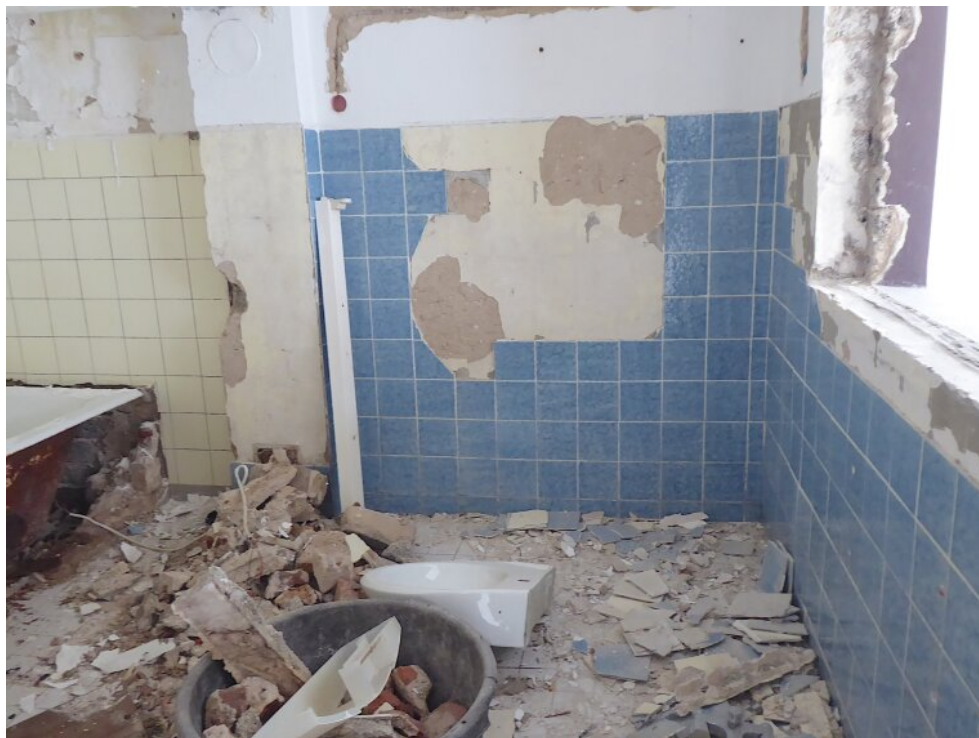
Tageslichtbad EG vorne