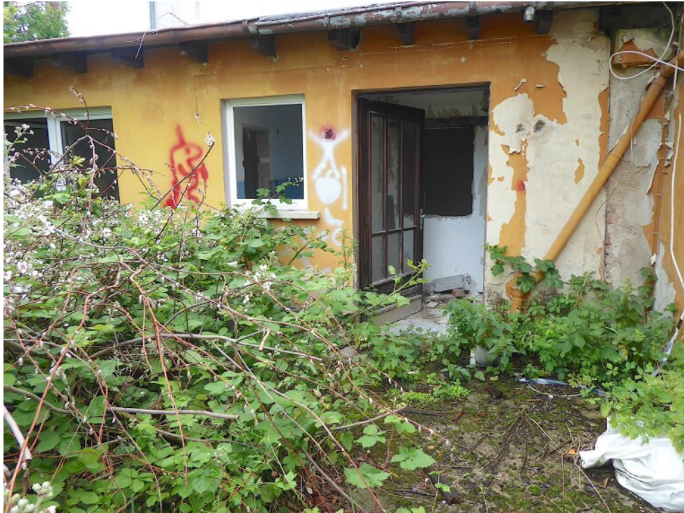
Garten mit Eingang Anbau