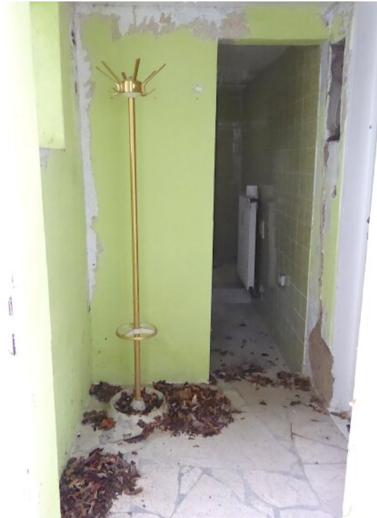
Eingangsbereich Wohnung vorne