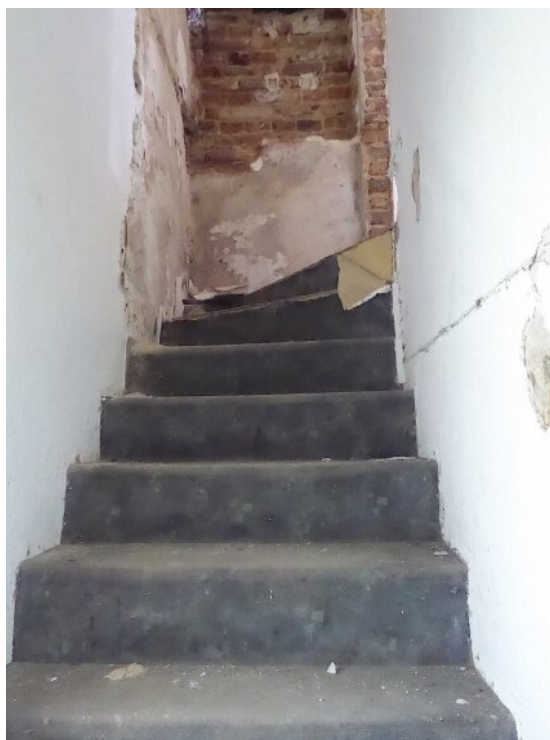
Treppe zum OG