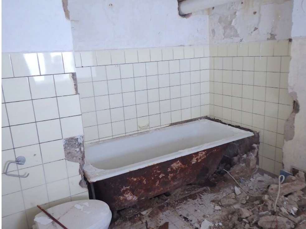
Bad EG vorne