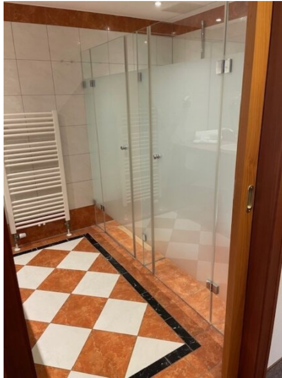
Bad App 2