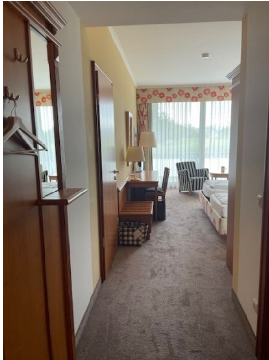
Flur App 1