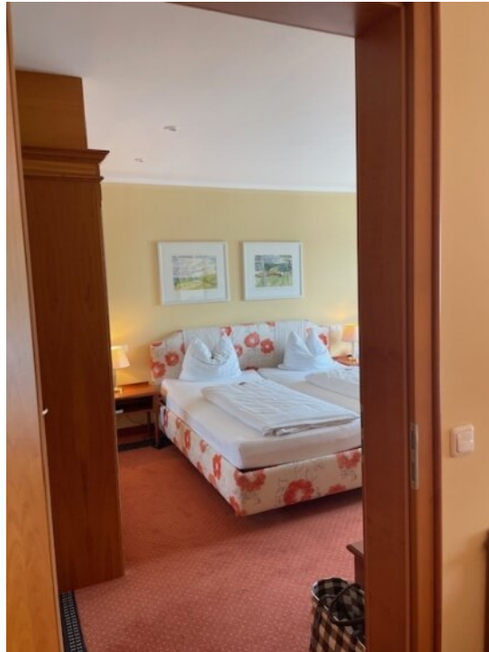
Durchgangstür zu App 2