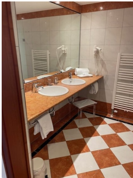
Bad App 2