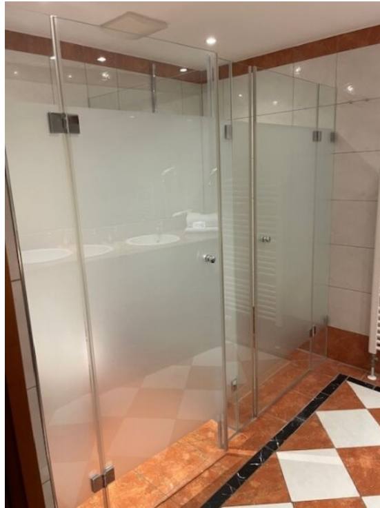
Bad App 1