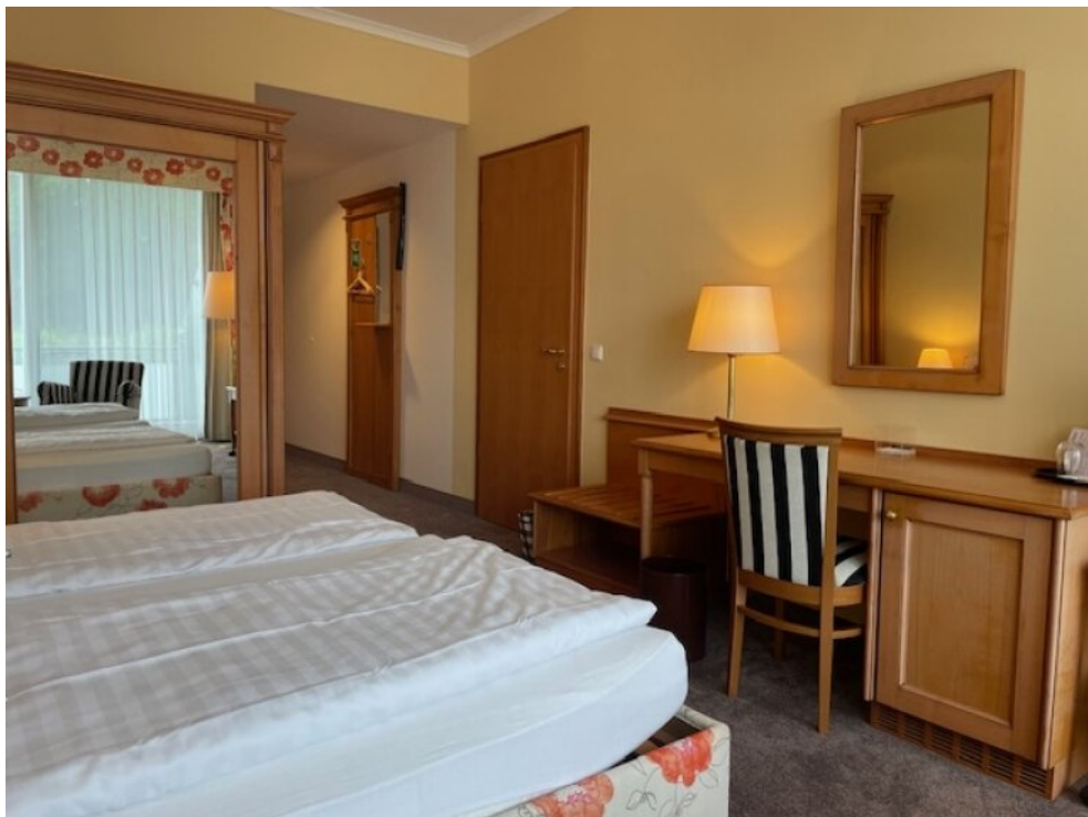
Wohnraum App 1 + Durchgangstür