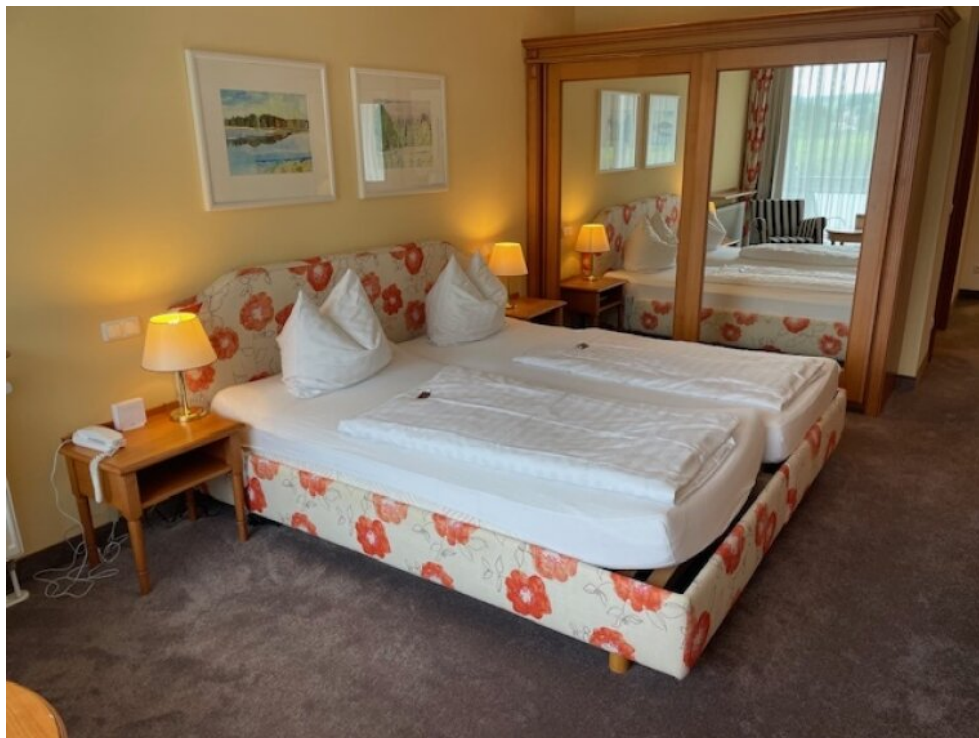
Wohnraum App 1