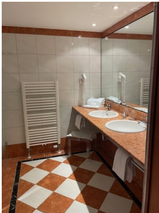
Bad App 1