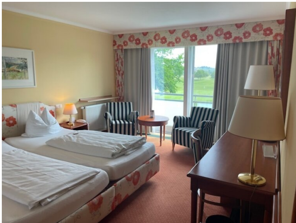
Wohnraum App 2