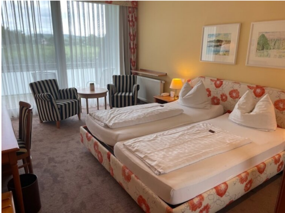
Wohnraum App 1