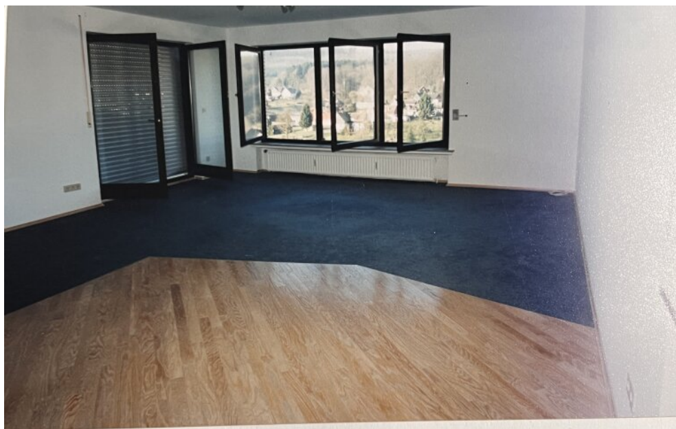
Wohnzimmer mit Balkontür