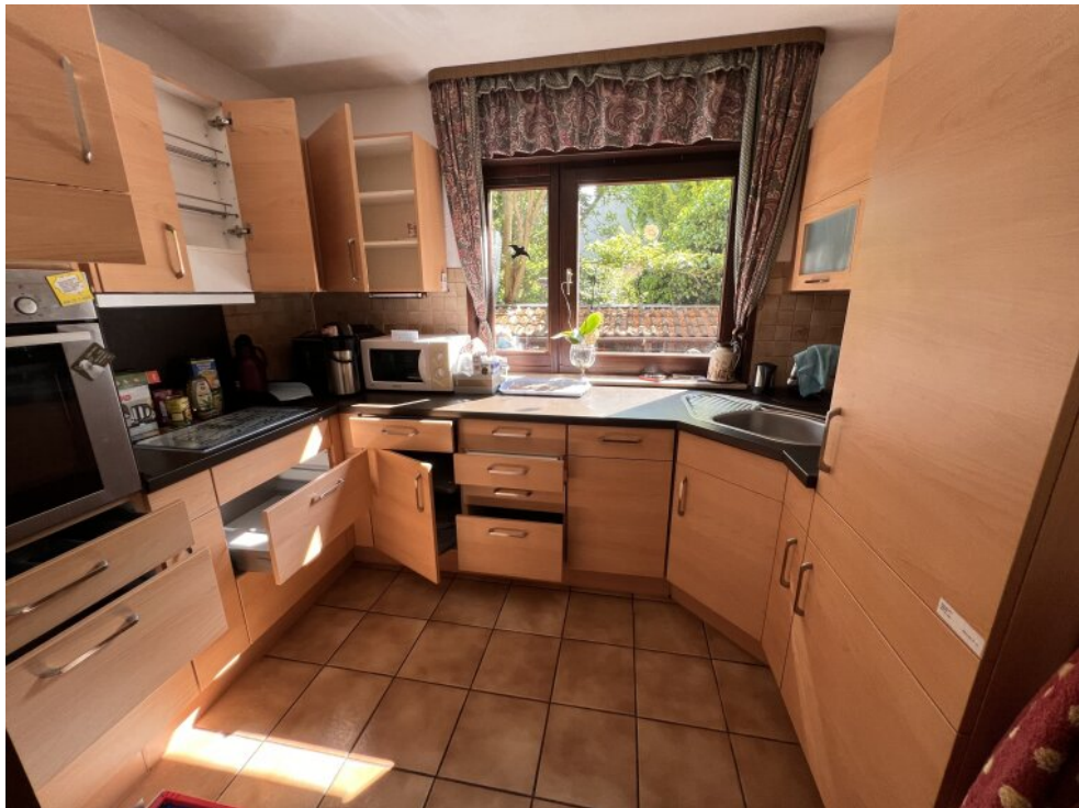
Küche Haus 2