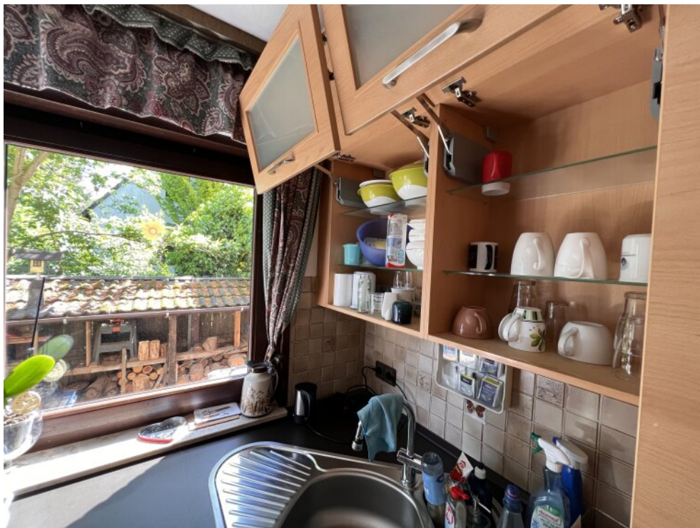
Küche Haus 2