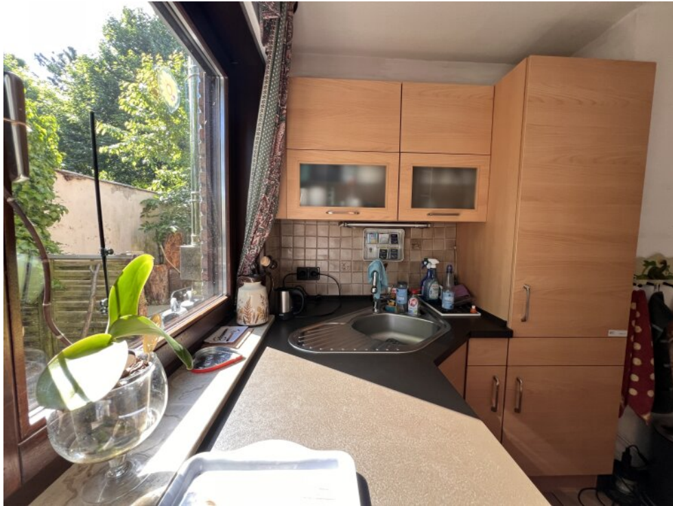
Küche Haus 2