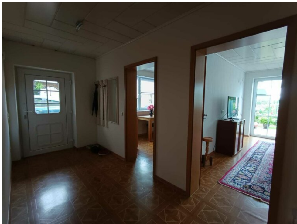
UG separater Eingang