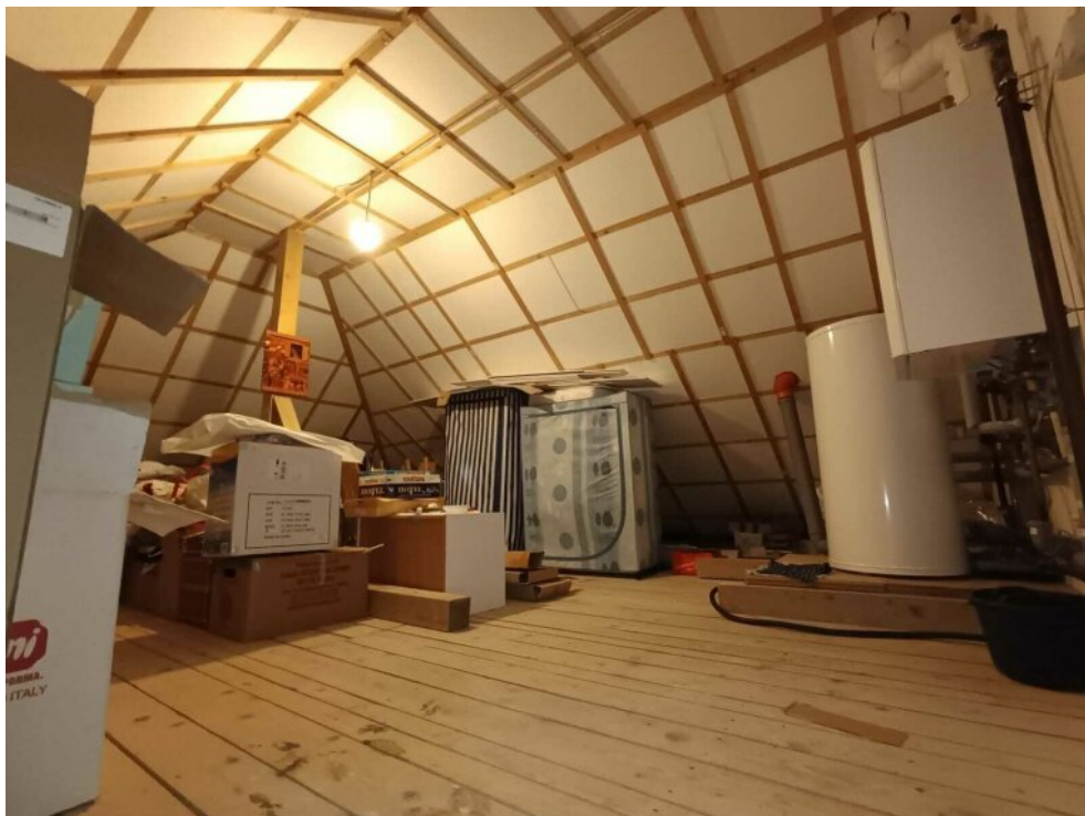
Gas-Heizung im Dachgeschoss