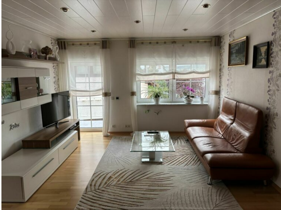
OG Fernsehecke mit Balkon