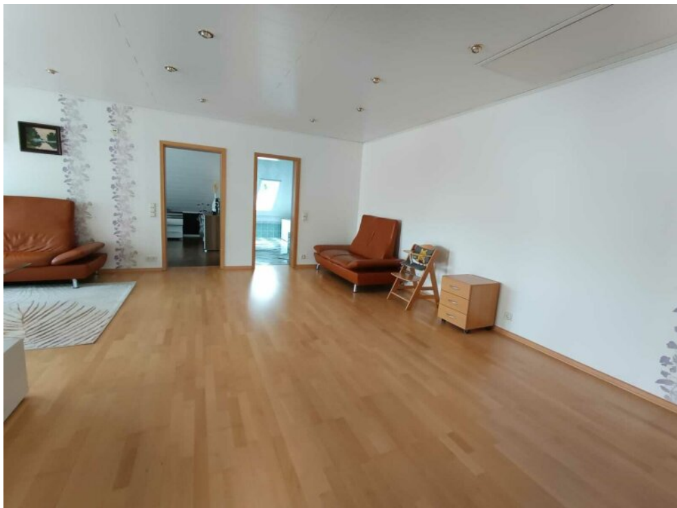
rechts Platz für Küchenzeile