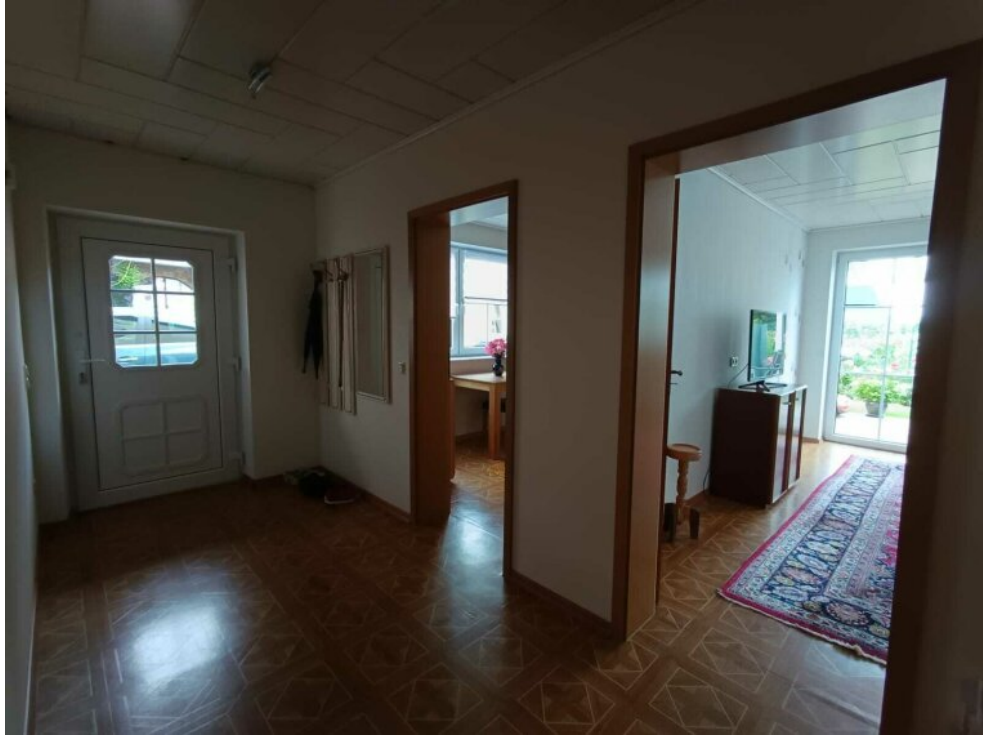
UG separater Eingang