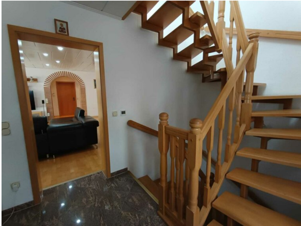
Treppe ins OG