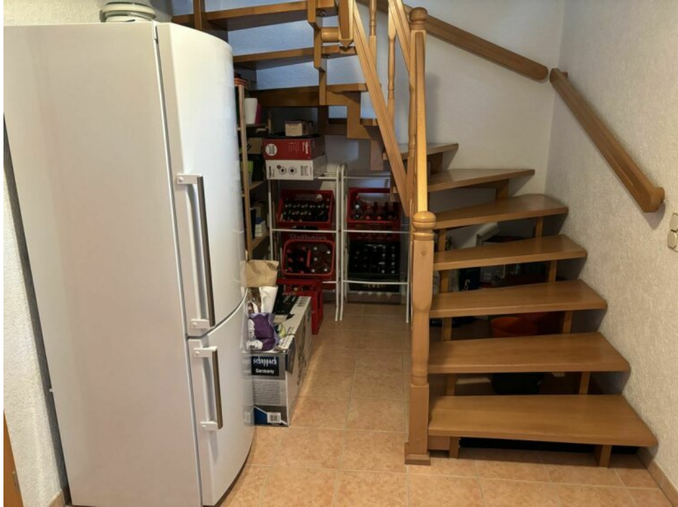
Treppe ins UG