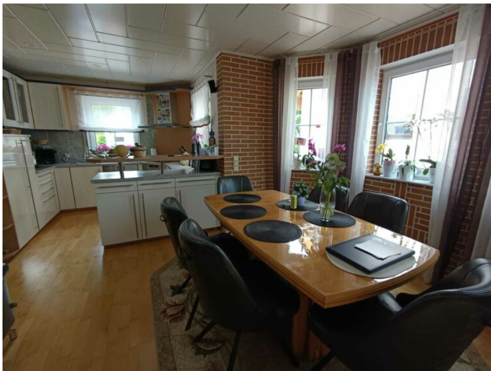
EG offene Küche mit Essplatz