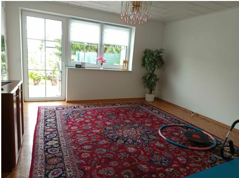
UG Wohnzimmer mit Terrasse