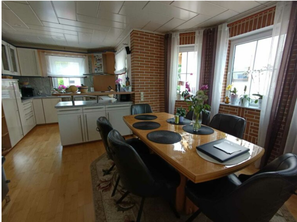
EG offene Küche mit Essplatz