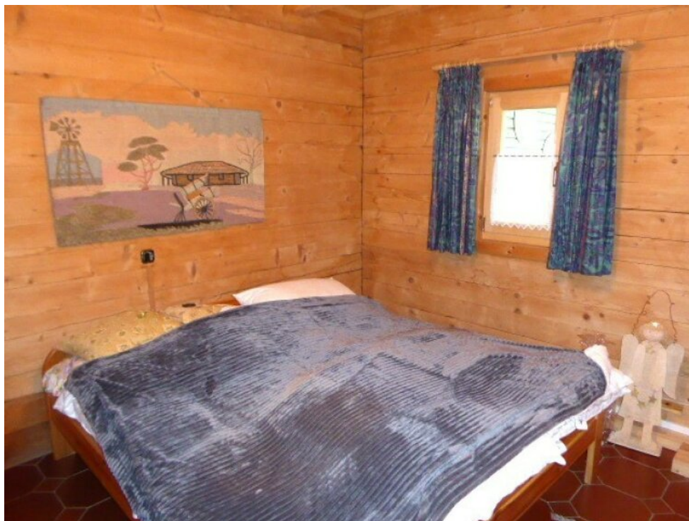
Schlafzimmer / Gästezimmer