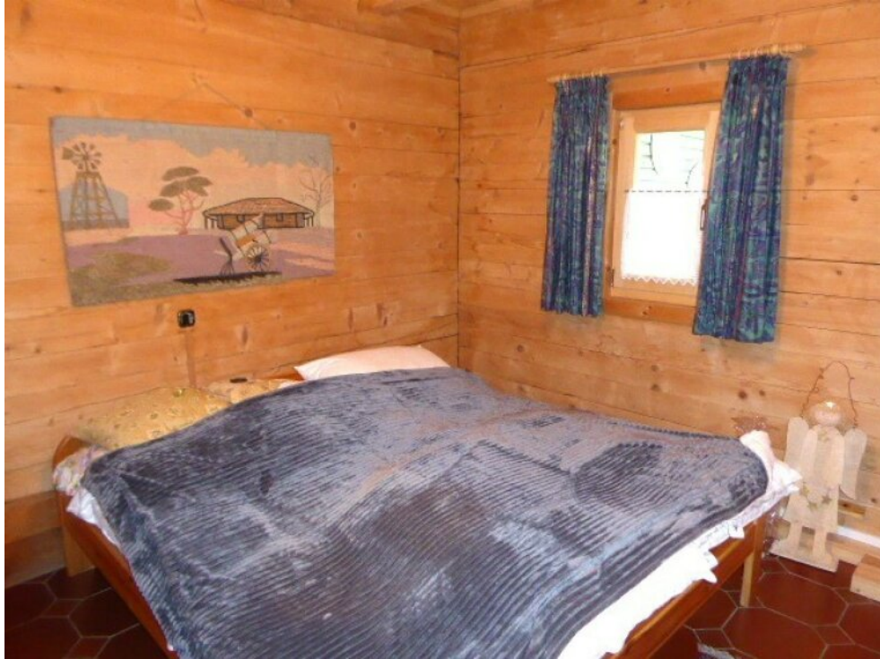
Schlafzimmer / Gästezimmer