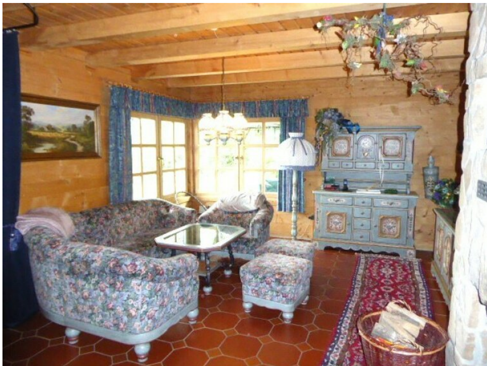
Blick aus Küche in Wohnzimmer