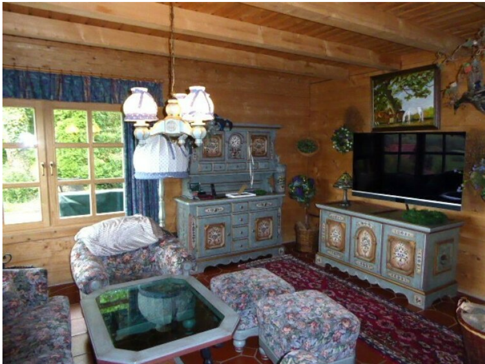
Wohnzimmer Ausgang Terrasse