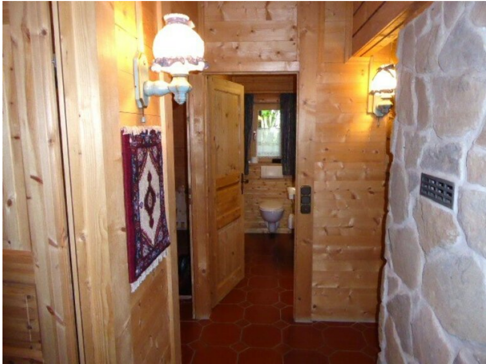
Flur aus Schlafzimmer