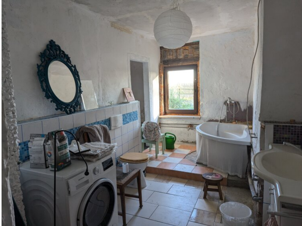
Bad mit Nebenraum