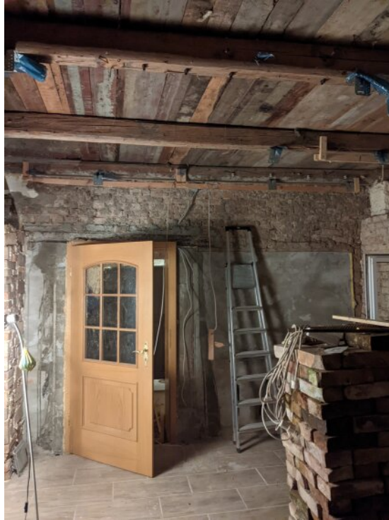
Nebenräume zur Erweiterung