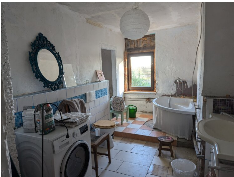
Bad mit Nebenraum