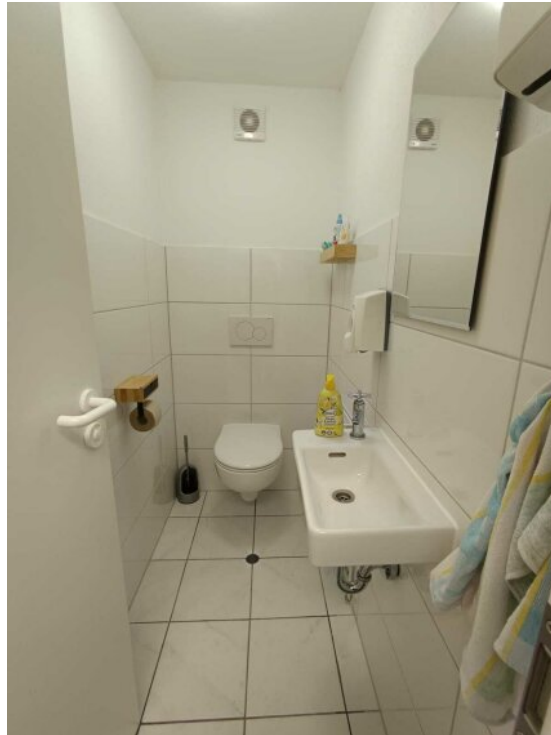
WC im Untergeschoss