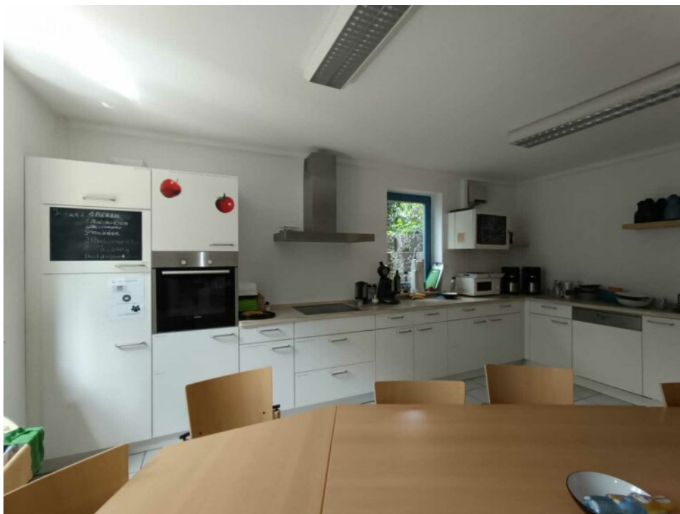
Mieter-Küche im Untergeschoss