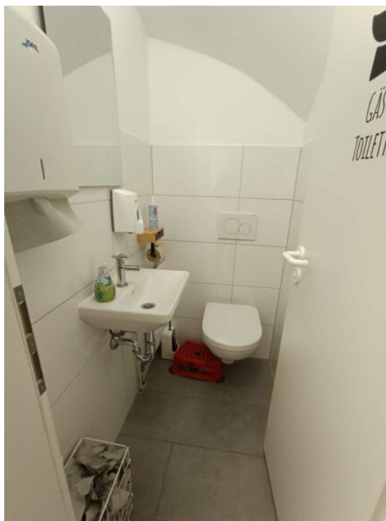
WC im Untergeschoss