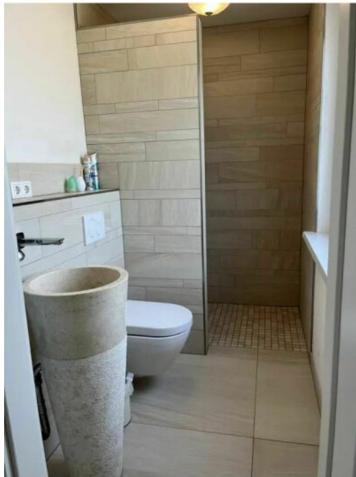
EG-Gäste WC mit Dusche