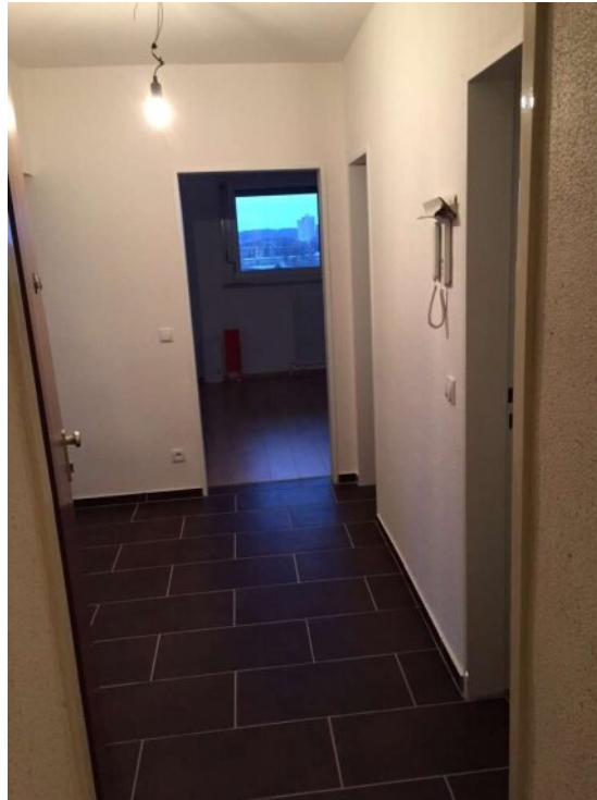
Flur Eingang Wohnung