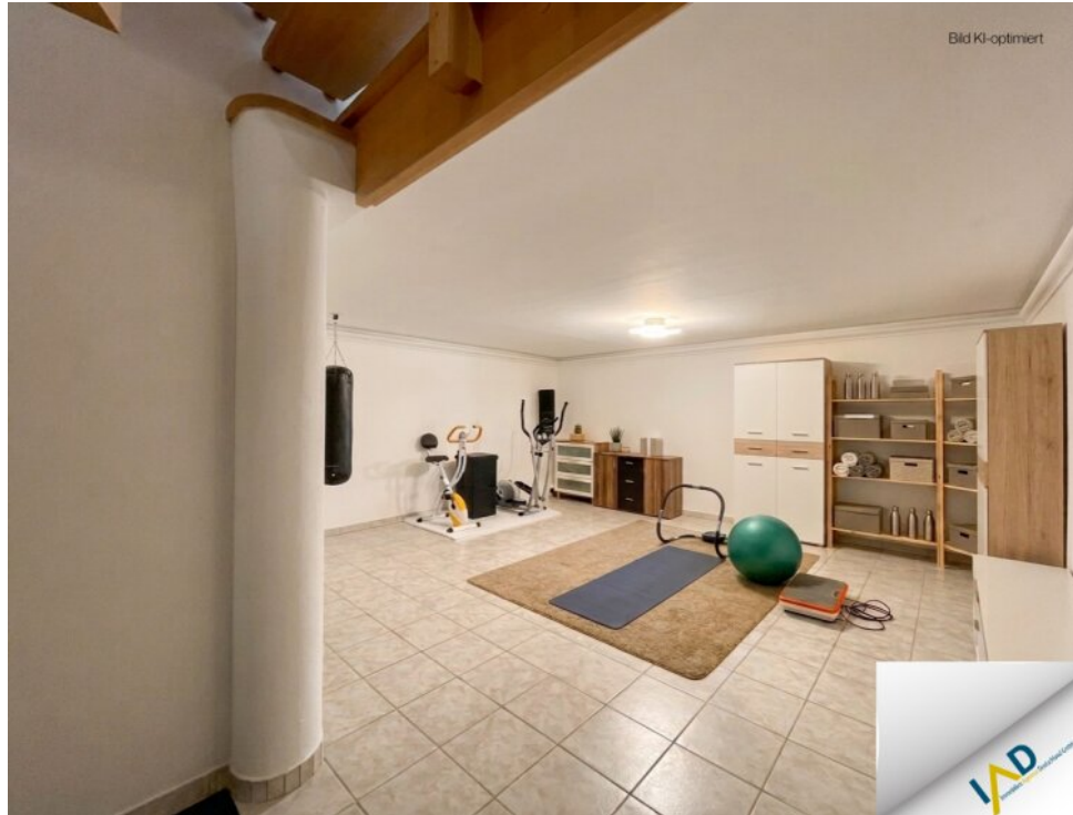
Fitnessbereich im Keller