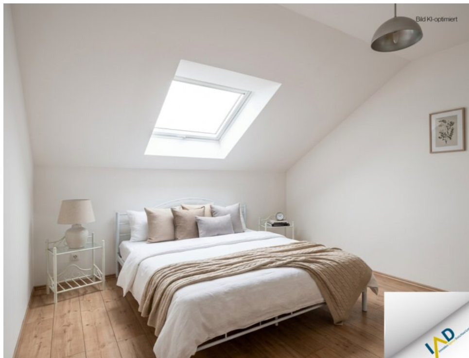
Gästezimmer : Kinderzimmer