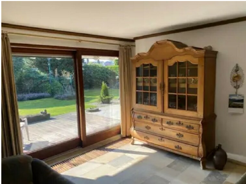
Esszimmer (Wohnung 1)