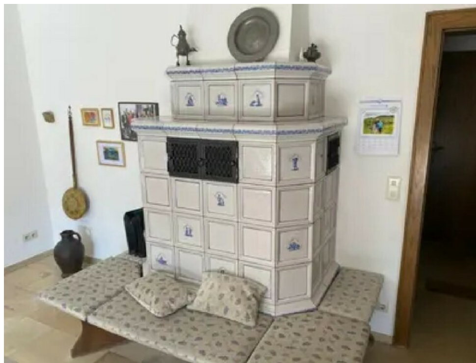
Esszimmer Kachelofen (Wohnung