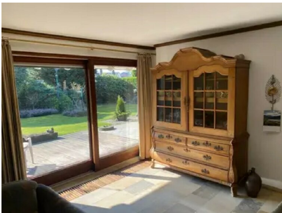
Esszimmer (Wohnung 1)