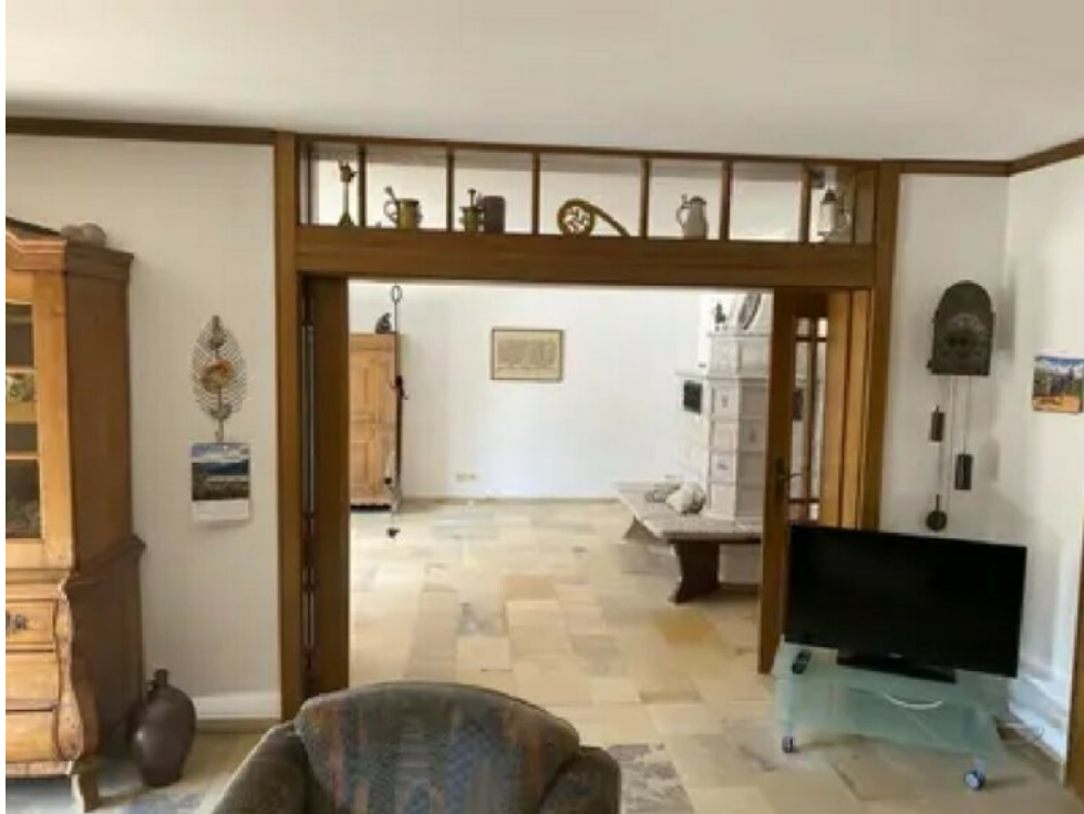
Wohnzimmer (Wohnung 1)