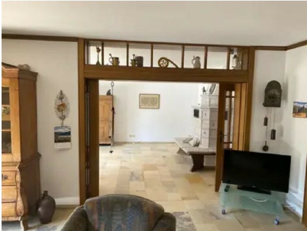
Wohnzimmer (Wohnung 1)