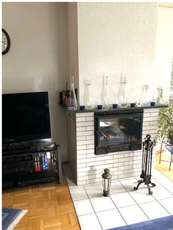
gemauerter Kamin Wohnzimmer