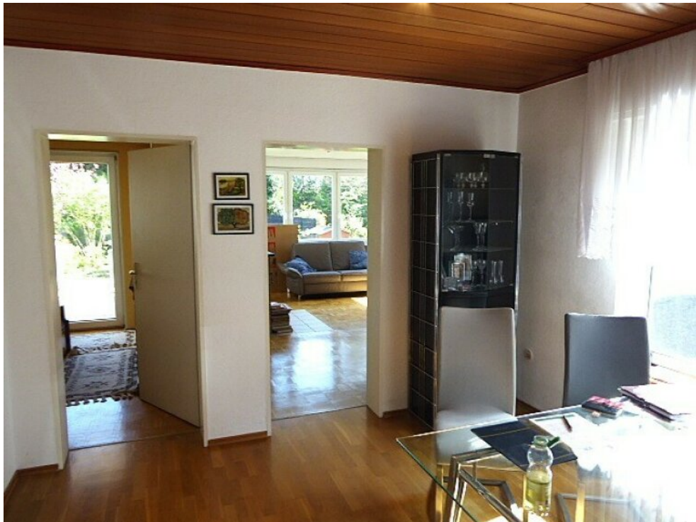
Wohn- Ess- und Schlafbereich