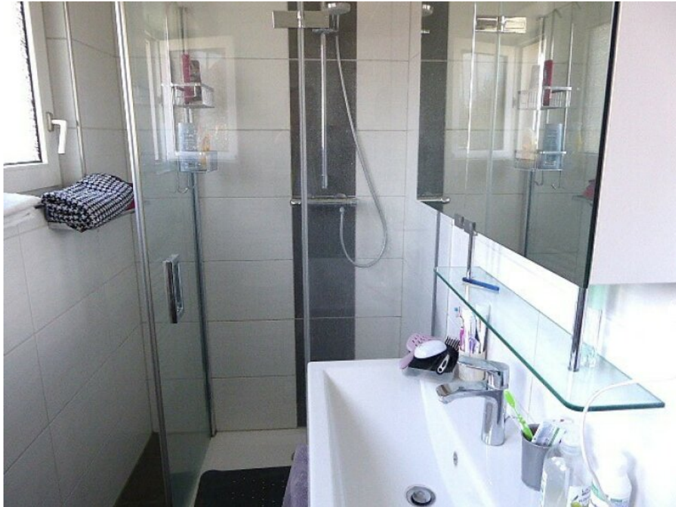
Tageslicht Bad ebenerdige Dusche