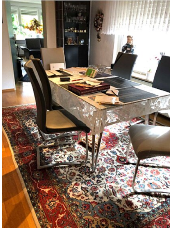
Essbereich Zugang Wohnzimmer