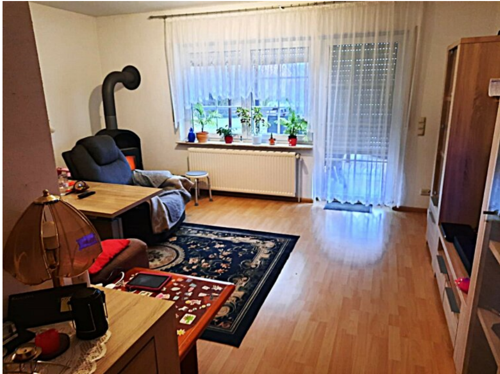
Lebensraum mit Kaminofen