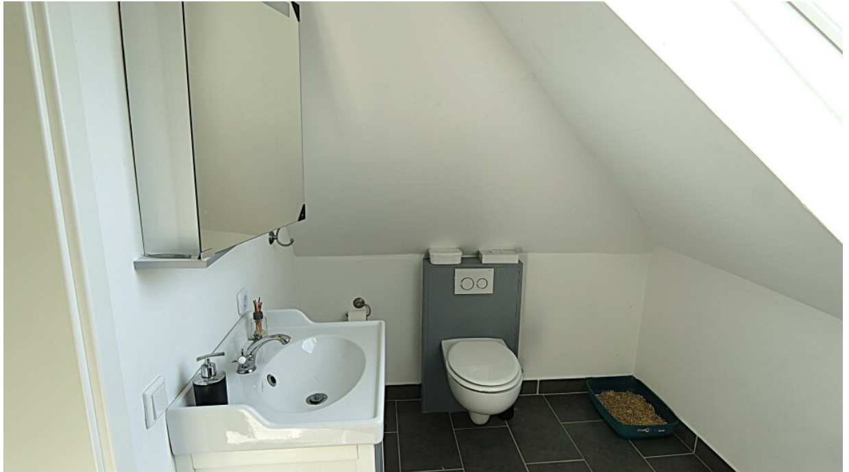
Bad mit Dusche (ELW)