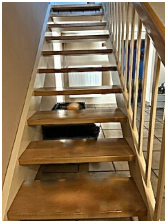
Treppe zur ELW