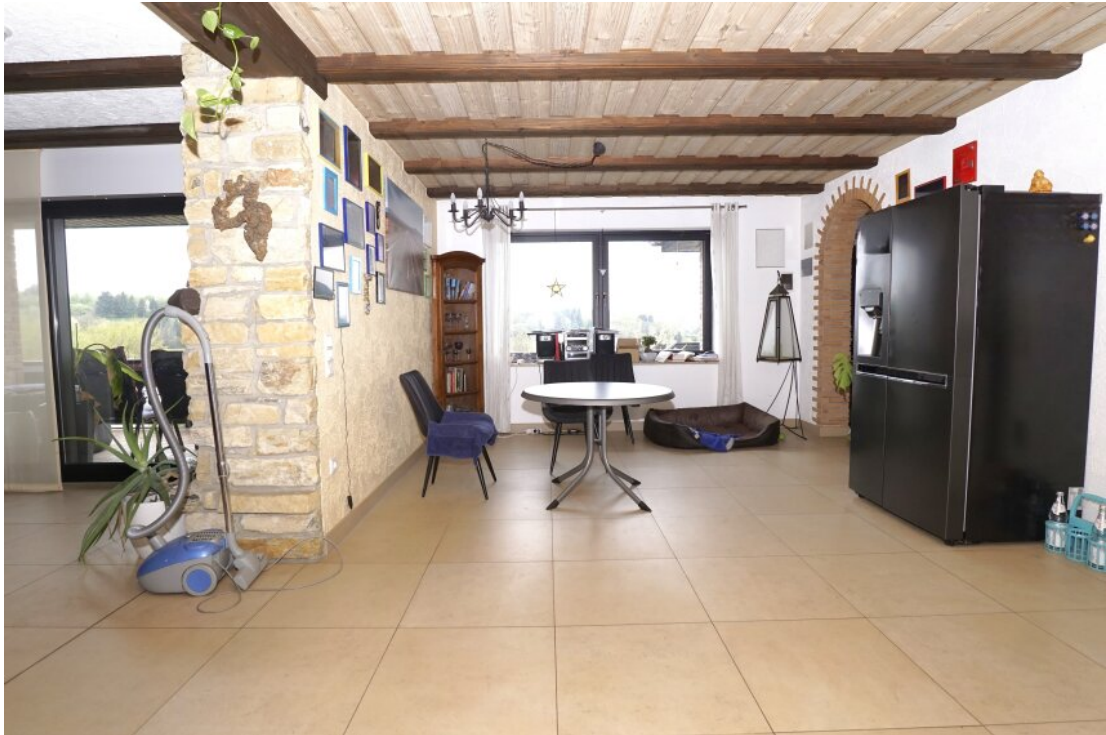
EG Ess Wohnbereich