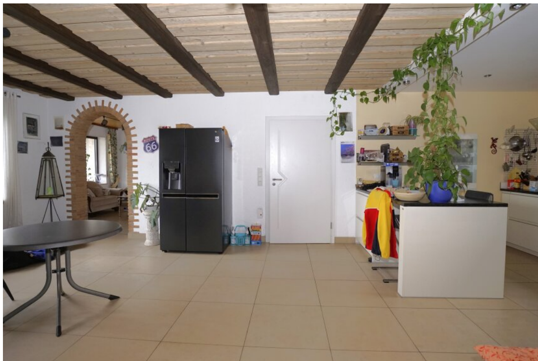
EG Essen Kochen