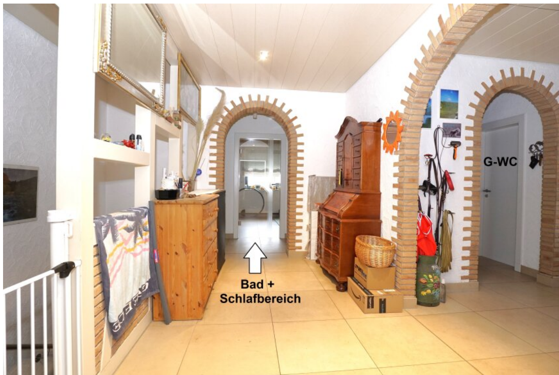
EG Eingangsbereich Diele