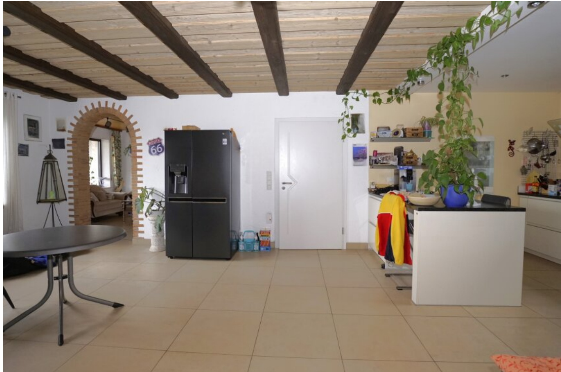
EG Essen Kochen