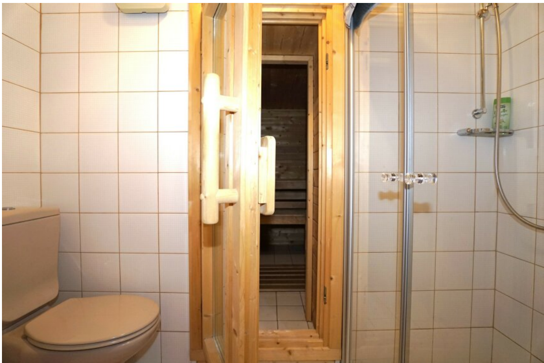
UG Sauna Dusche