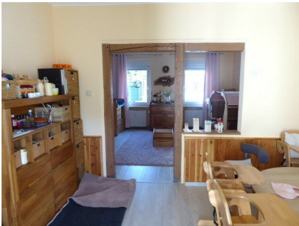
Wohn- Essbereich EG