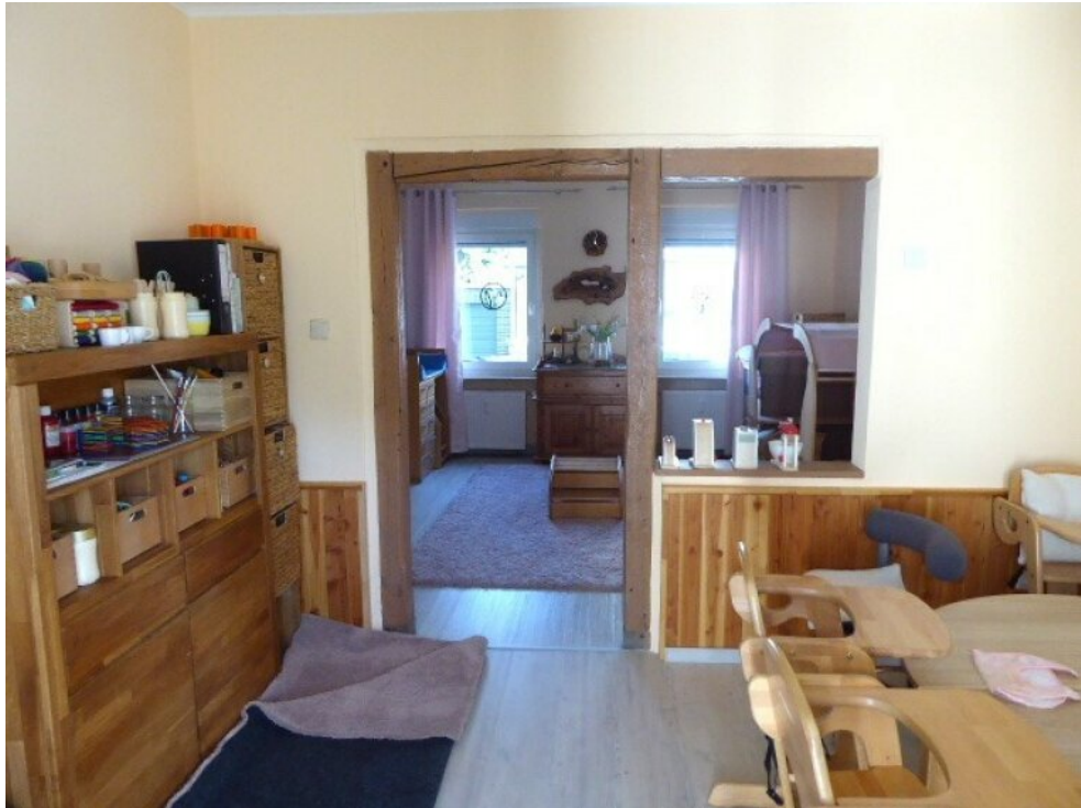
Wohn- Essbereich EG