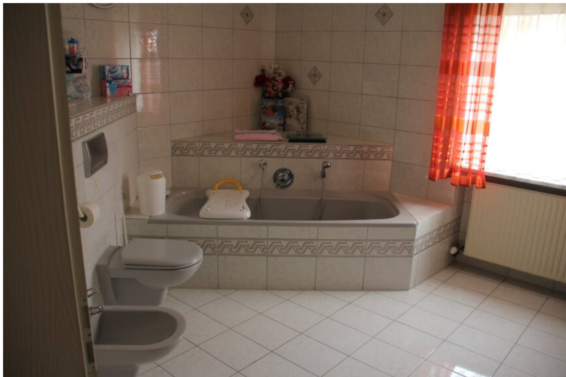
Bad mit Badewanne und Dusche