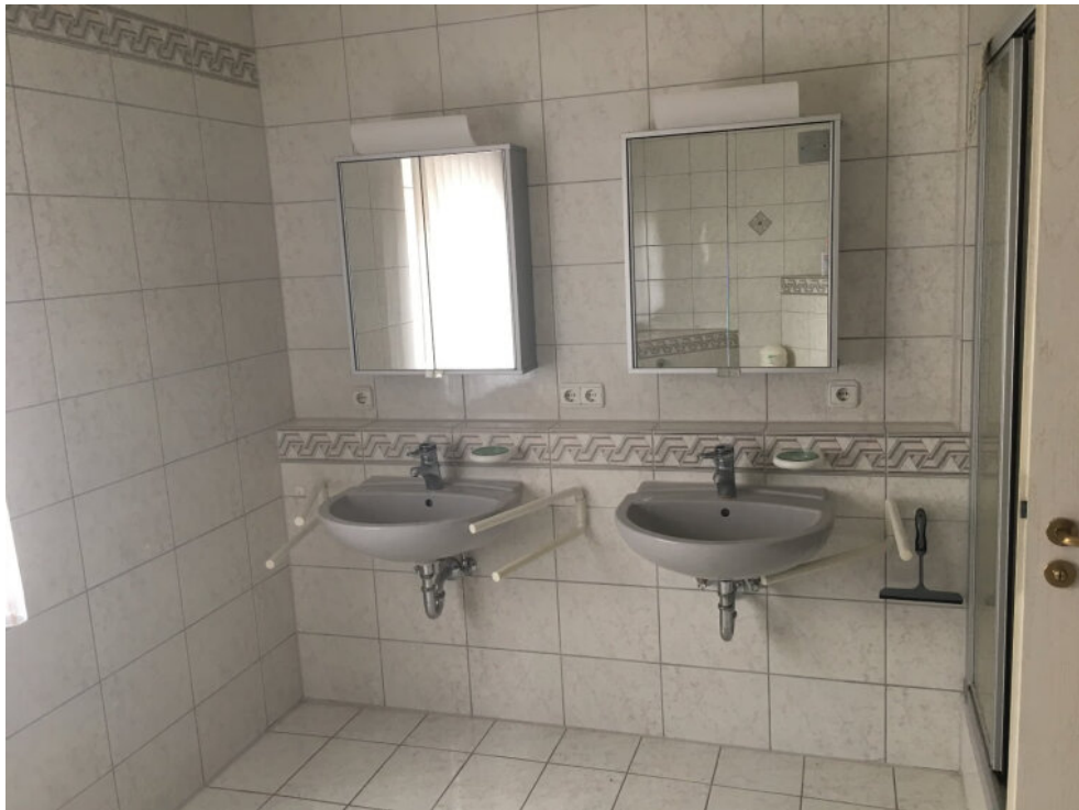
Bad mit 2 Waschbecken