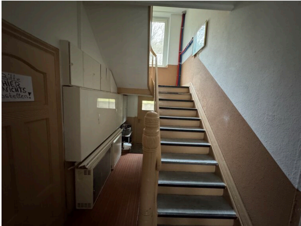
Zugang Garten / Treppenhaus