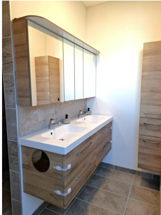
Bad OG 2