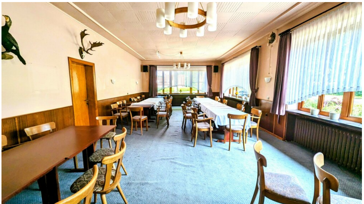
Speisesaal mit Bestuhlung