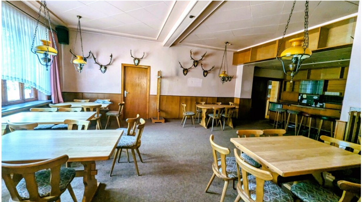
Schankraum mit Theke und Zapfanlage