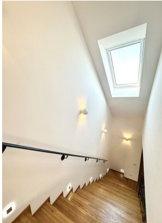
Treppe zum 1. Obergeschoss