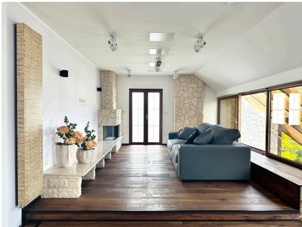
1. OG Galerie/ Kamin No.2