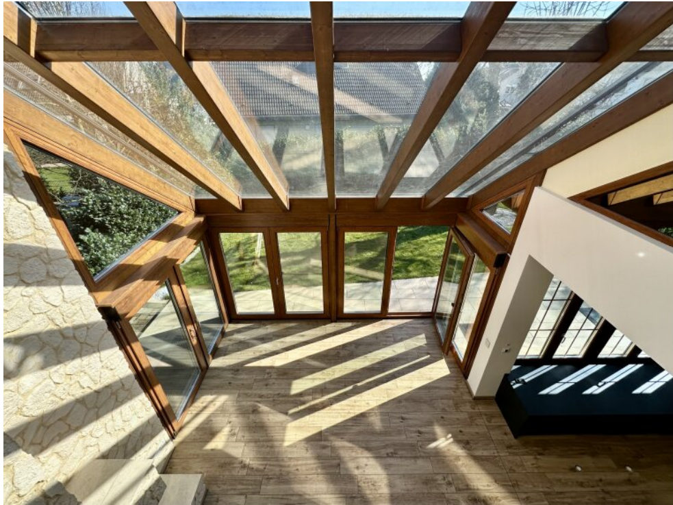
1. OG Galerie