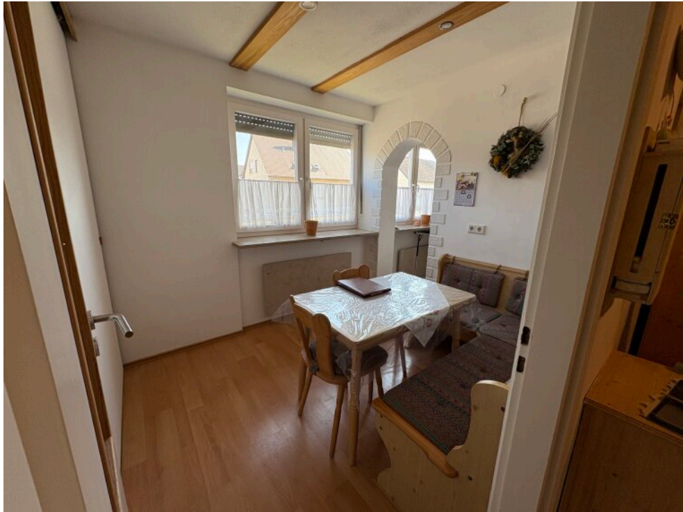
ehemals KZ jetzt Esszimmer