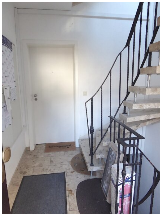
Hausflur mit Eingang Wohnung