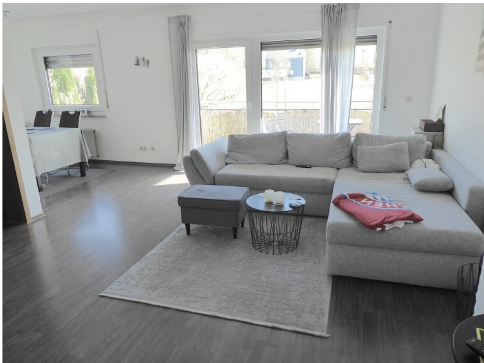
Wohnbereich mit Ausgang Balkon