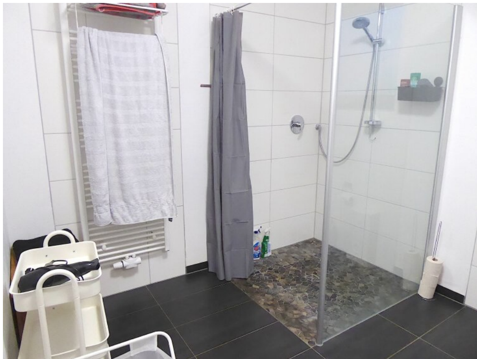
Bad mit ebener Dusche