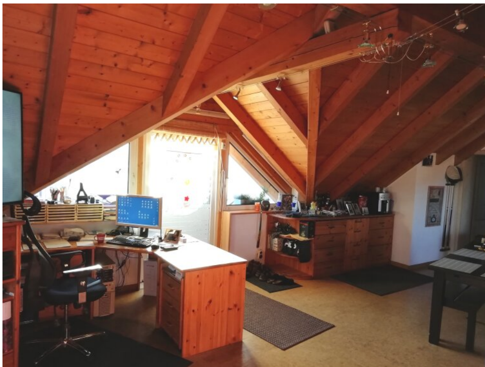
WG 3. Wohnzimmer