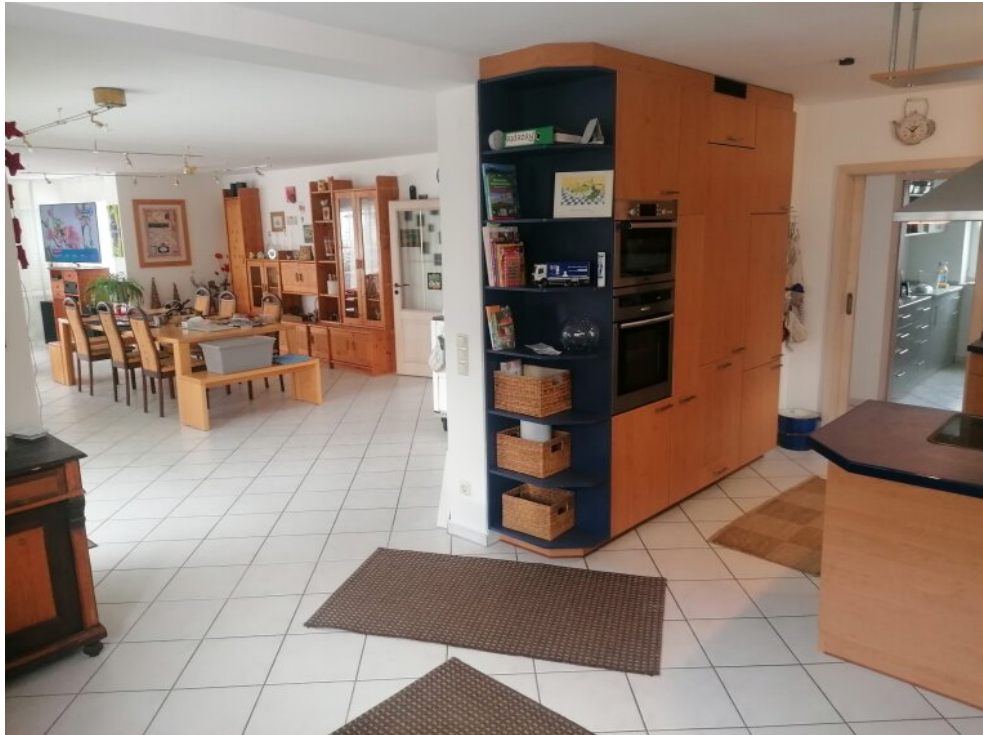
EG. Wohnzimmer und Küche