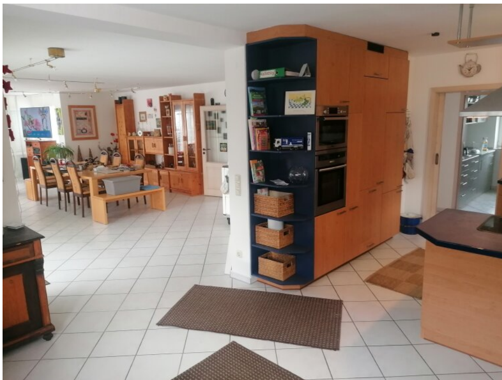
EG. Wohnzimmer und Küche