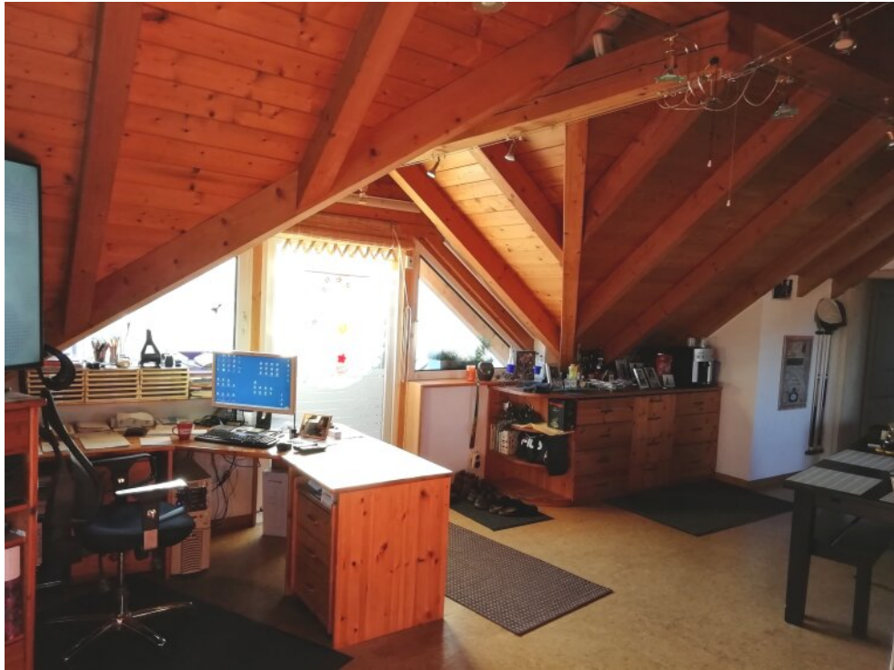
WG 3. Wohnzimmer