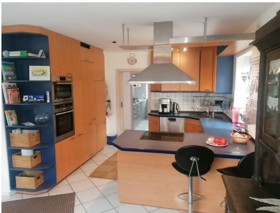
EG. Wohnzimmer und Küche