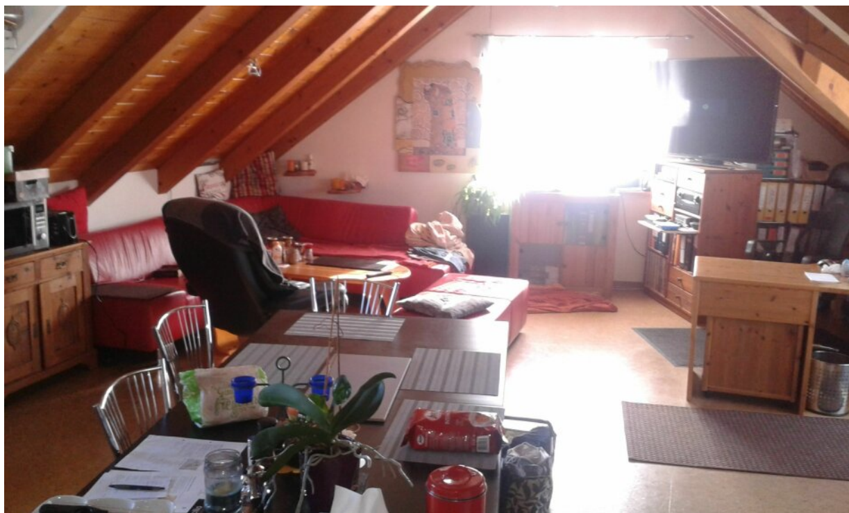
WG 3 Wohnzimmer