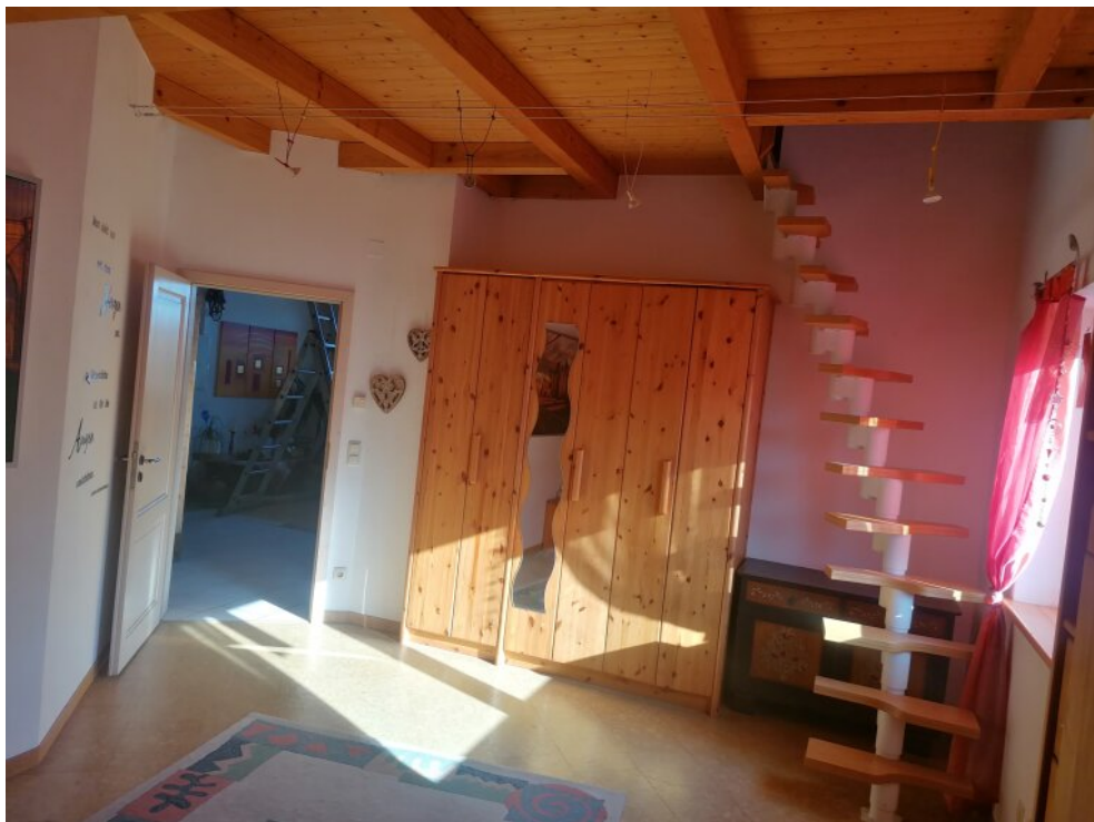
WG 3 Schlafzimmer