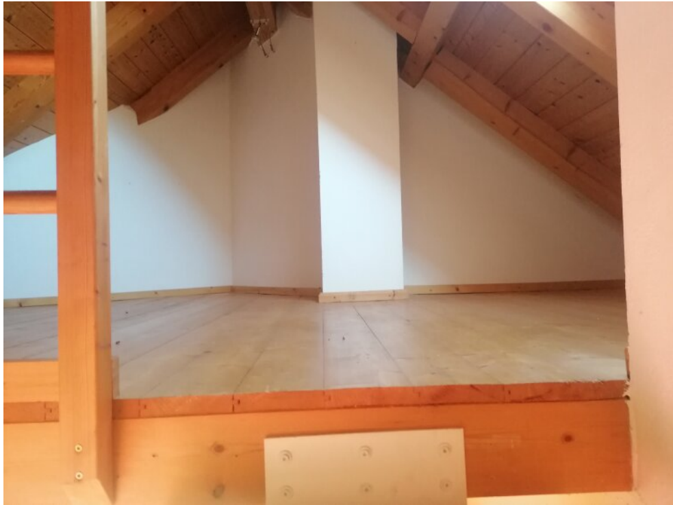
WG 3 Schlafzimmer