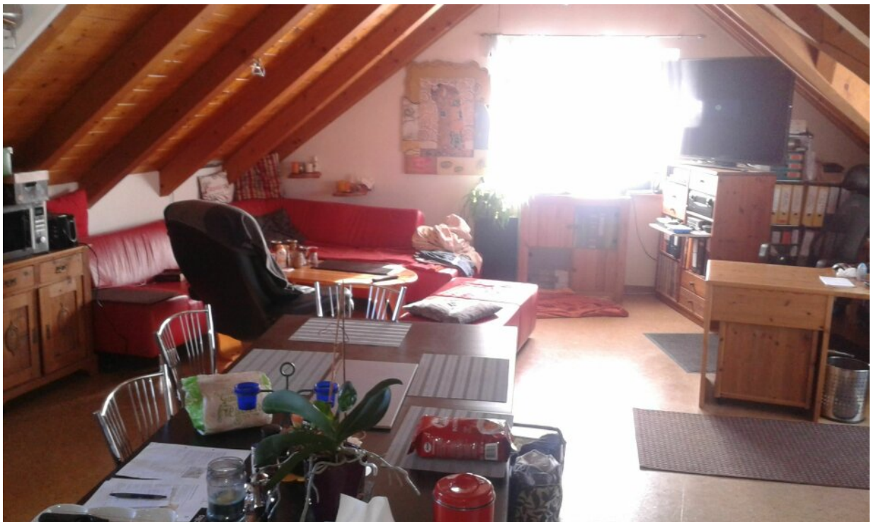
WG 3 Wohnzimmer