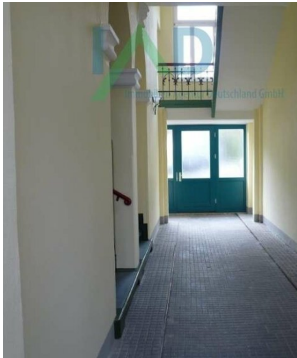
Durchgang im Treppenhaus