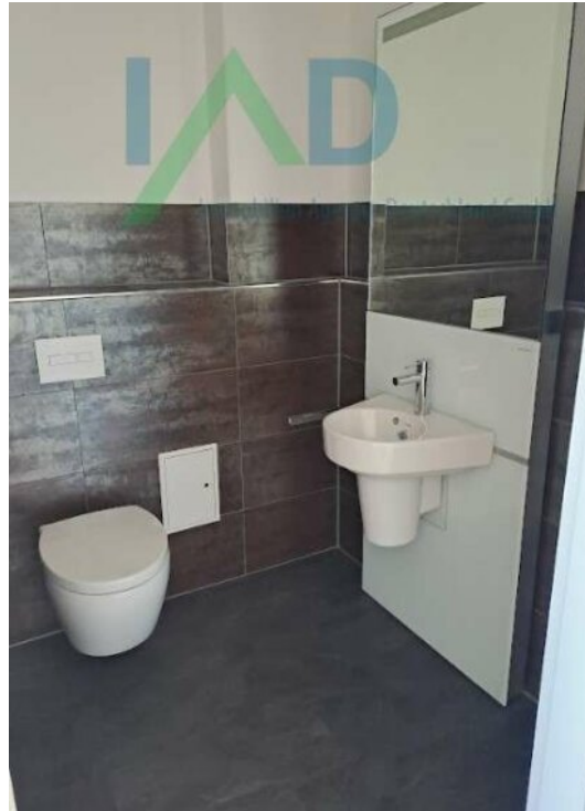
Separates WC und zusätzliche G