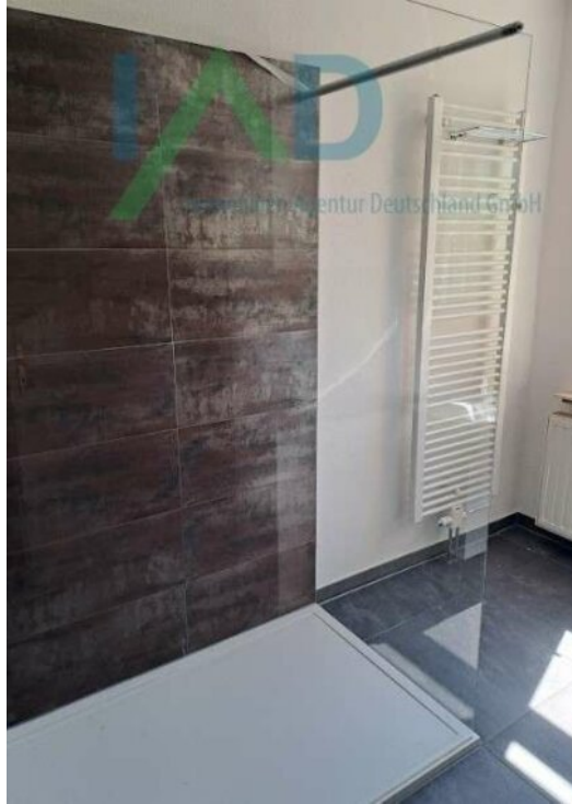
Beispiel Bad im EG