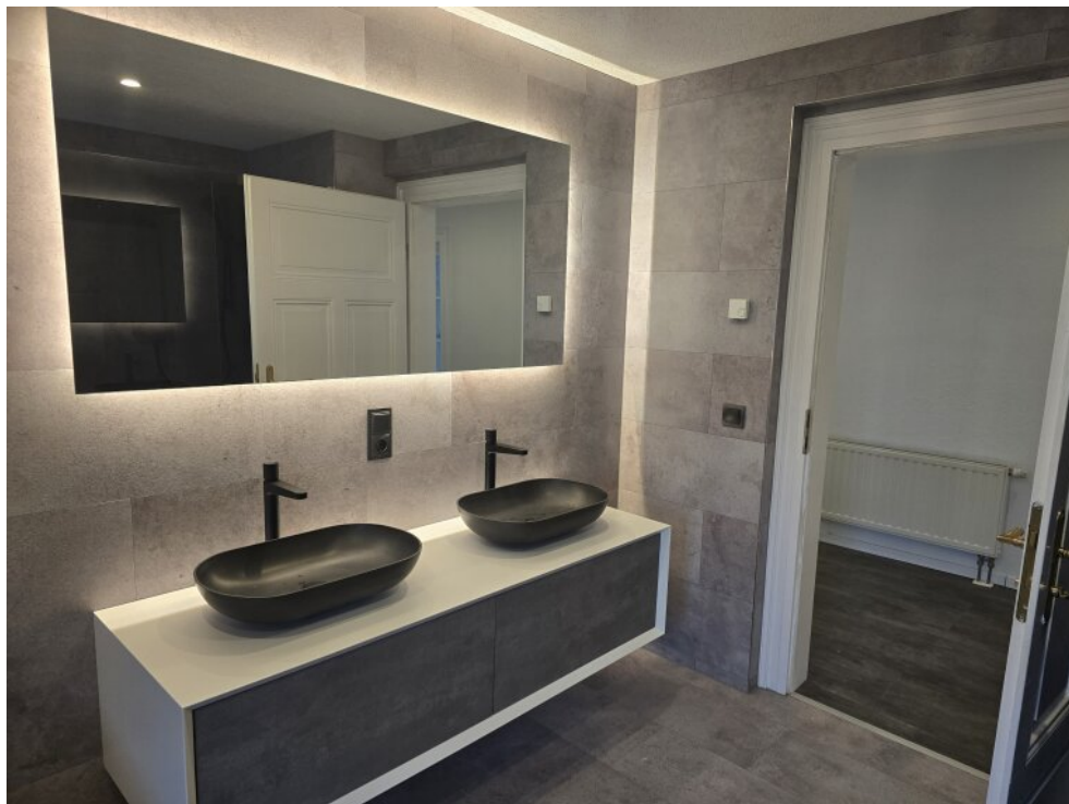
Bad in der Dachgeschoßwohnung