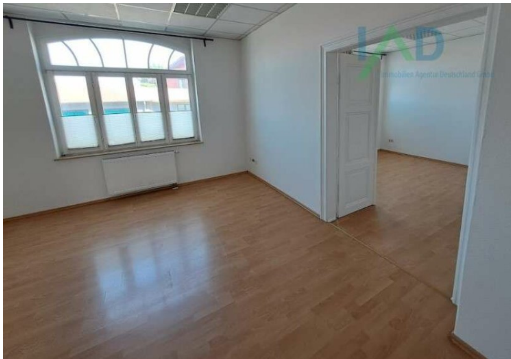
Helle Räume mit Schallschutzfenster