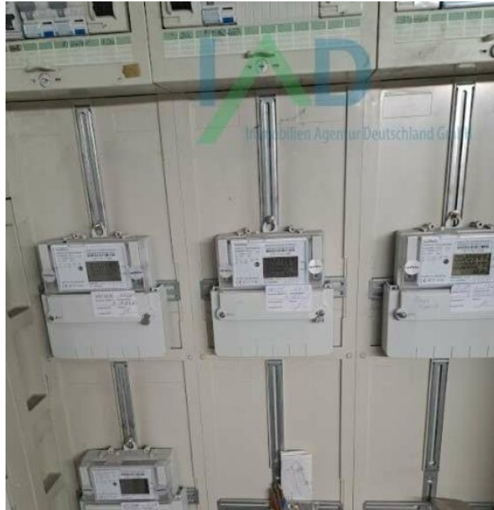
Komplett neue Elektrik