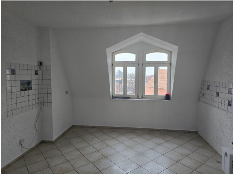
Küche im DG