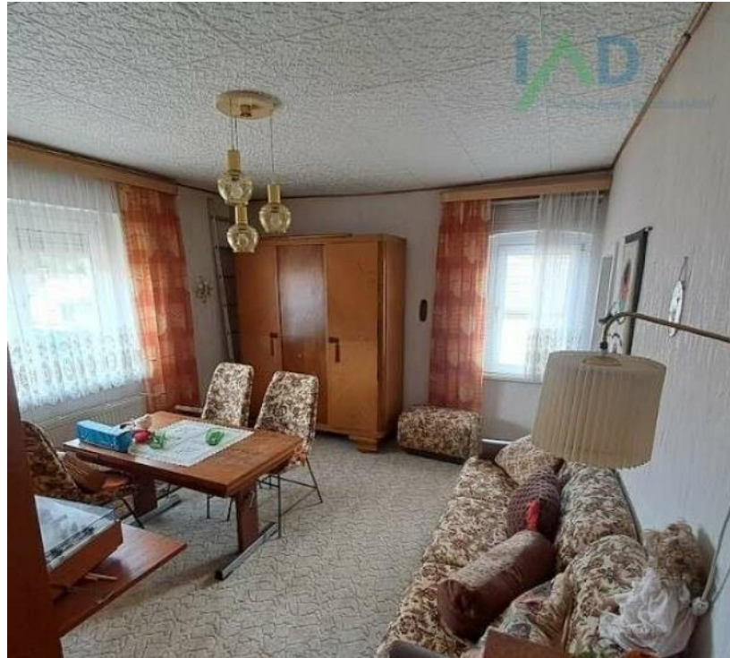
Arbeits- bzw. Kinderzimmer