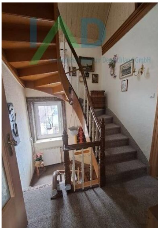
Treppe zum DG