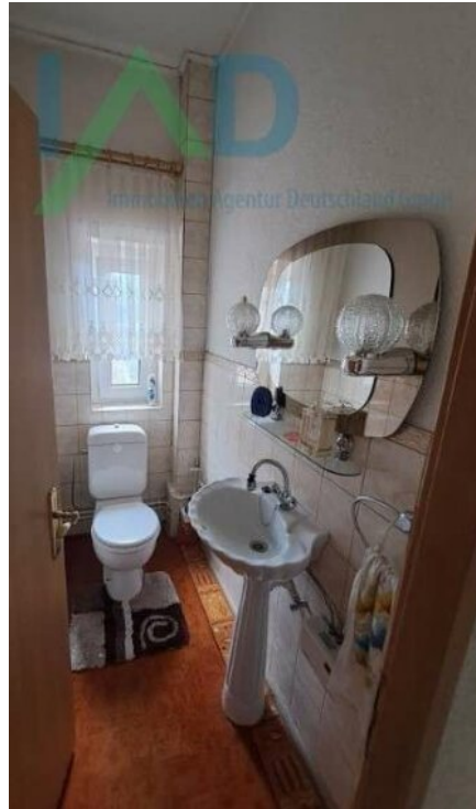
Separates WC im OG