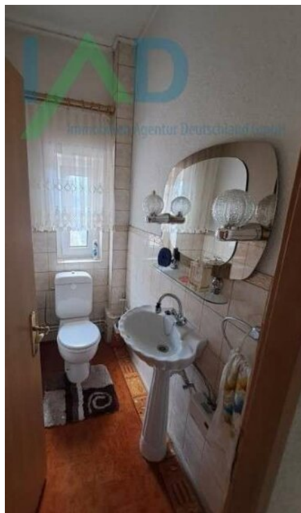
Separates WC im OG