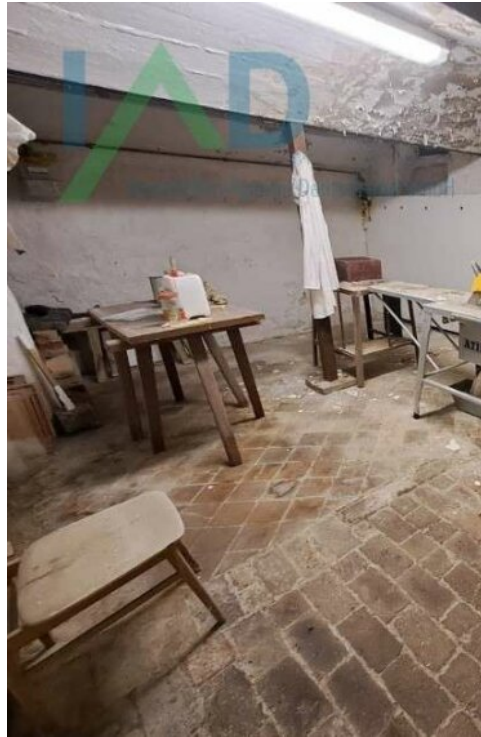
Gewölbekeller mit Werkstatt_La