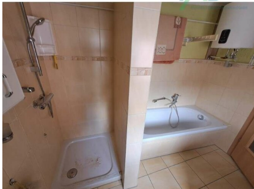
Bad im OG