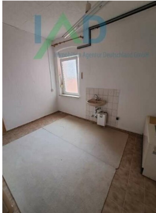
Küche und Lager in der Gewerbe