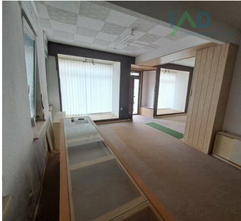
Verkaus- bzw. Bürobereich der