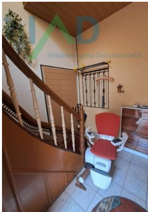
Treppe EG zum OG mit Treppenli