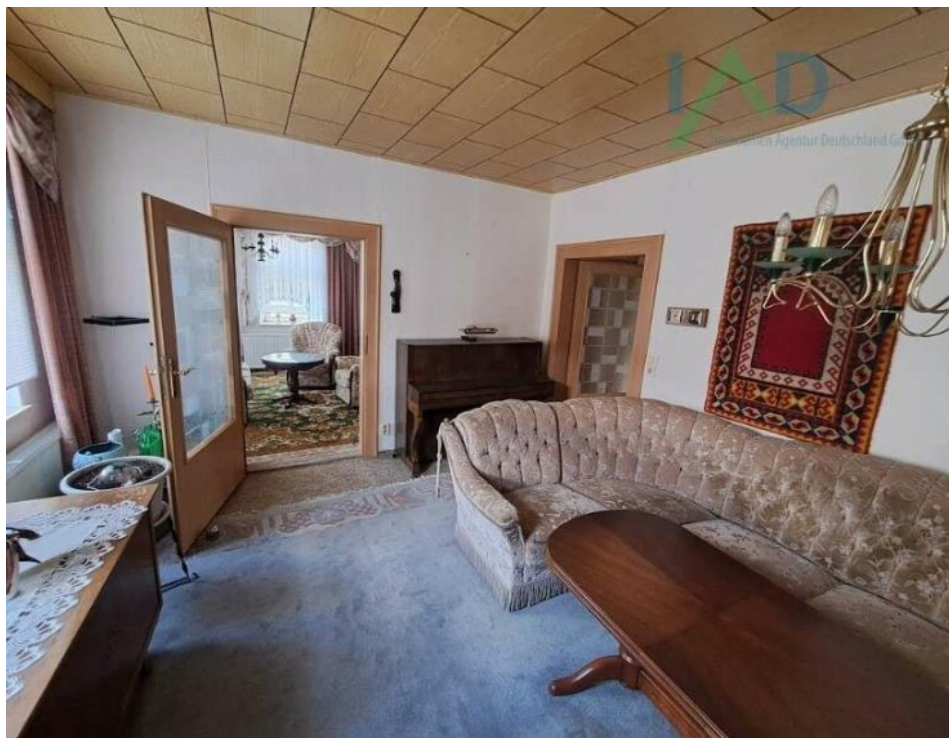
Wohnzimmer mit Zugang zum Arbe