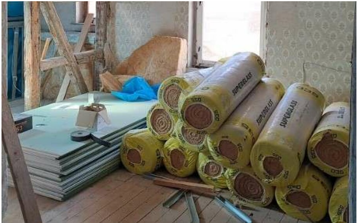
Vorhandenes Ausbaumaterial inc