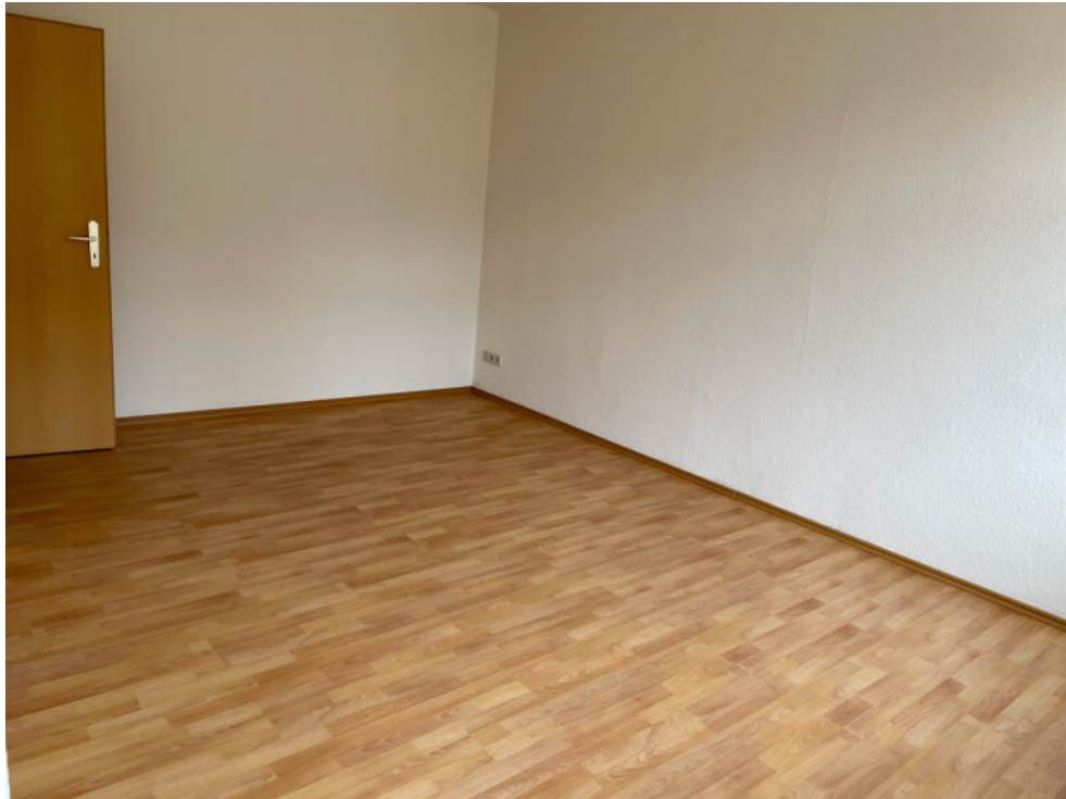
Wohn- und Schlafzimmer