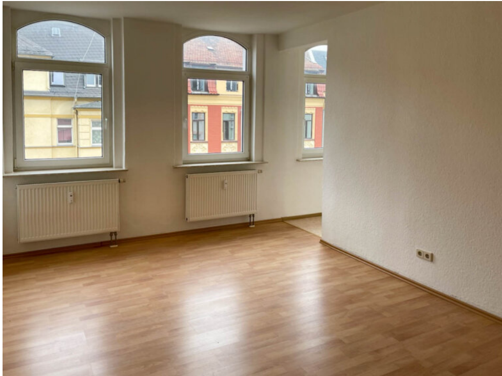
Wohn- und Schlafzimmer