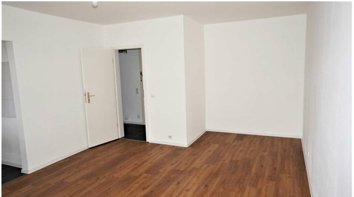
Wohnbereich zum Flur